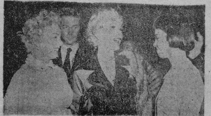
La última fiesta de Hollywood, congregó entre otras famosas estrellas, a la rutilante Zsa-Zsa

Gabor y a la ingenua Leslie Caron que charlan amistosamente, mientras dura el "guateque"