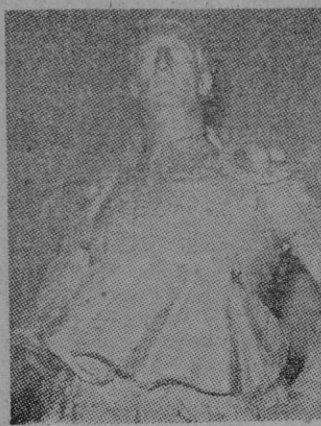
Monumento a «Manolete»