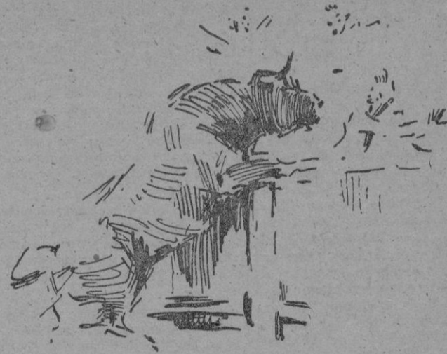
El susto que le dió uno de los toros al maestro carpintero de la plaza

Si tienes, lector amable, curiosidad por descubrir el misterio, te lo explicaré: en la plaza, el torero siempre es el mismo hombre, aunque padezca dolor de muelas, aunque le duela un callo. El que cambia cada tarde en el ruedo es el toro, un animal que tiene corazón, nervios, sangre y músculos, y que por tanto, es sensible y reacciona, unas veces para atacar de manera boyante y otras con instinto más perverso. Los ganaderos que poseen toros bravos y nobles, o boyantes, hacen pagar muy caras sus reses, por ser las elegidas por los diestros de mayor fuste. Un lote de seis toros no baja en su precio de ciento setenta mil pesetas. Los otros ganaderos, los