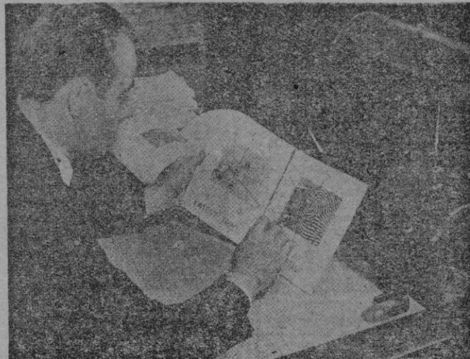
Agente de Scotland Yard observando huellas digitales

Si las exhumaciones tuvieron lugar puede abandonarse la idea de descubrir síntomas de envenenamiento.