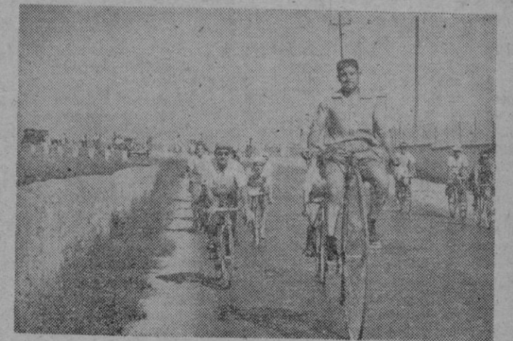
Abriendo marcha, la famosa bicicleta antiquísima ya conocida de todas las fiestas del Pedal, y siguiéndoles, una parte de los componentes de la caravana ciclista.

llores, y en segundo lugar ha quedado evidenciado que, cuando se solicita una colaboración para acometer empresas de tal naturaleza, nadie deja de responder a la llamada. Tenemos en esta oportunidad un verdadero ejemplo.