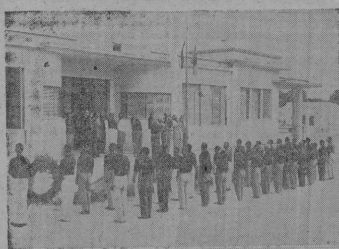
Solemne momento de arriar banderas.

Ayer por la tarde, a las 6 en punto, se celebró el acto de clausura del turno masculino del Albergue Nacional que el Servicio Español del Magisterio tiene instalado en El Arenal.