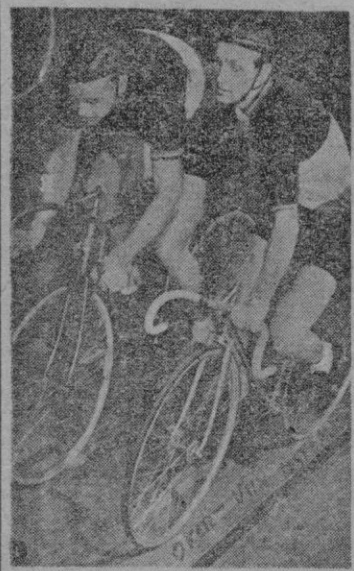
A la izquierda podemos ver a Van Steenberg, que el domingo conquistó el campeonato mundial de fondo en carretera. El que le da el relevo es Ockers, el ex-campeón.

pero al pisar la cinta iba en primer lugar Van der Lijke y Florentino Magni (Italia). El tiempo empleado en esta tercera vuelta fue de 20 minutos 38 segundos. Bahamontes (España) se vio obligado a abandonar en la tercera vuelta, por enfermedad. Gerard Voorting (Holanda) perdió con-