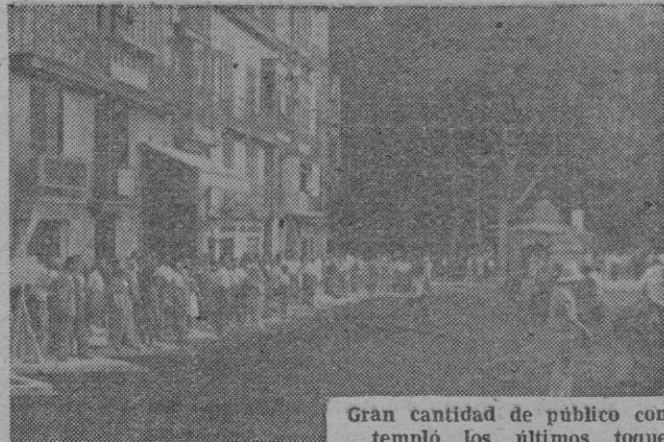
Gran cantidad de público contempló los últimos toques dados el sábado a la Plaza, hasta su total terminación.

tion. Quéde constancia pues del gesto: "D. Bartolomé Ramón se comprometió a entregar la Plaza el sábado, y el sábado a las 5 de la tarde, la Plaza estaba terminada y entregada". Enhorabuena, don Bartolomé, y que sigan los éxitos.