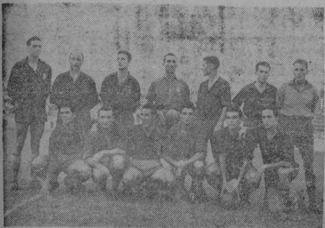
Equipo del R. C. D. Mallorca, que el domingo venció al España Industrial por el elevado tanteo de 7-2.