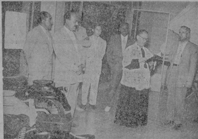
El Vicario de San Miguel, en el momento de la bendición de las instalaciones

del barrio de San Miguel. Concurrieron un numeroso grupo de invitados que fueron