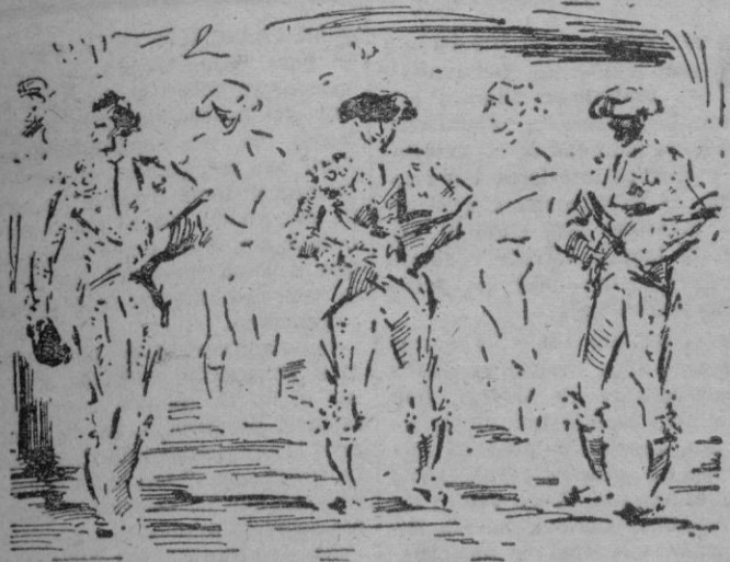
Las cuadrillas, antes de iniciar el paseíllo

Milagrosamente, los toreros quedaron vivos