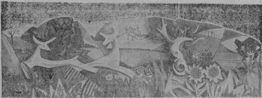
"Decoraciones Quint", que en estas últimas semanas ha realizado las decoraciones más originales y modernas que se conocen en la isla, se apunta otro buen éxito con los murales de "La Cabaña", bello bar anclado en Cala Mayor, de ambiente cosmopolita