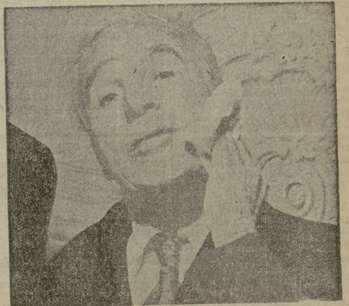
Charles Chaplin, «Charlot»

aprovecharlas. A las más ricas las conquista completamente, y hace que le entreguen sus ahorros. Entonces las invita a visitar su casa de Gambais y saca dos billetes: uno de ida y otro de vuelta y vuelta. Este detalle será uno de los que le perderán ante el tribunal. Las novias no volvían nunca y