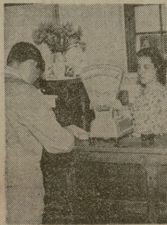
Nueva expendeduría de sellos en el Palacio de Comunicaciones, instalada para descongestionar la que funcionaba y resultaba insuficiente.