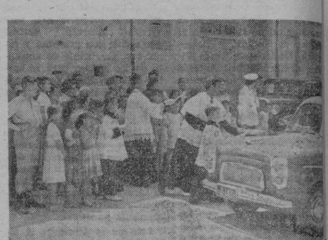
Un momento de la bendición de vehículos y el reparto de premios del Sindicato de Transportes y Comunicaciones, en actos celebrados con motivo de la festividad de San Cristóbal.

Ayer, festividad de San Cristóbal, el Sindicato Provincial de Transportes y Comunicaciones celebró con diversos actos y festejos el día de su Santo Patrón.