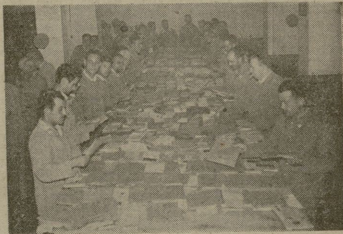
Abrumador es el trabajo de clasificación y distribución en Cartería de la enorme cantidad de correspondencia que llega diariamente a Palma.