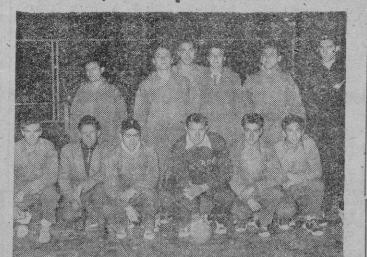
El equipo de balón mano de Baleares, que, al proclamarse campeón de Sector, pasa a la final del Campeonato de España.