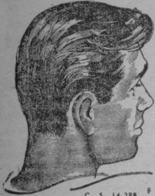
C. S. 14.388 F