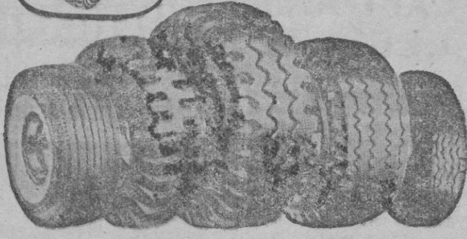
SAP-T-MILER NON DIRECTIONAL H. C. T. HIGHWAY MILIMETRICA

Distribuidor exclusivo COMERCIAL GARAGE SEGURA