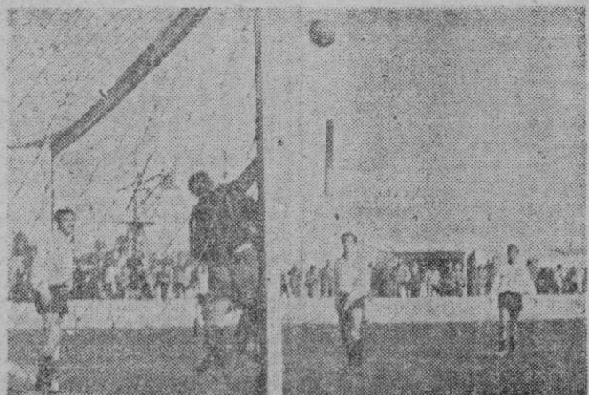
El meta inguense salva de pñños uno de los muchos momentos de puro que atravesó su puerta, en el partido contra el Soledad

No fue muy lucido el encuentro del pasado domingo, en "Es Colomeres" pese al resultado registrado, el encuentro entre el Soledad y el Constanca.