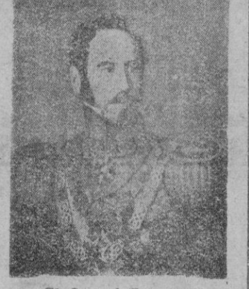
El General Espartero

LA BELLEZA DE LAS DAMAS MALLORQUINAS En la tarde del día siguiente organizóse una vistosa exhibición gimnástica militar que terminó en un lucisísimo baile. Las bellas formas y el gentil continente clásicos brillaron aquella noche en las damas mallorquinas. No hay mujeres feas en Mallorca — confiesan los extranjeros — dice el "Diario Balear" y lo confirmarian si hubieran presenciado el baile del Regimiento de Soria. Con esta expresión, aparte su veracidad, se sintió el cronista influenciado por aquella idéntica de don Juan Pablo Gondi de Retz, personaje influyente de la Francia del cardenal de Richelieu que estuvo en nuestra ciudad de paso para Roma en su época. Terminado el baile los oficiales obsequiaron con un magnífico refresco a las jóvenes "dando muestras de su diligencia y porte obsequioso con las damas".