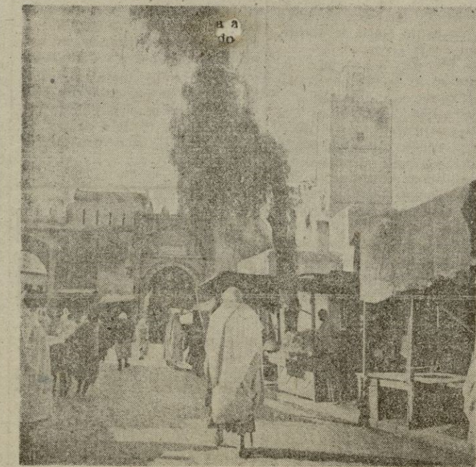
Un aspecto de la feria anual de tapices y alfombras de la ciudad santa de Keruan