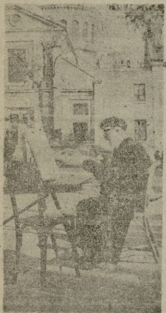
Una de las últimas fotografías de Utrillo, pintando en París

Los hombres mueren y las flores caen. Este otoño, quizá como tantos otros, estamos presenciando un largo desfile de figuras fiestres que