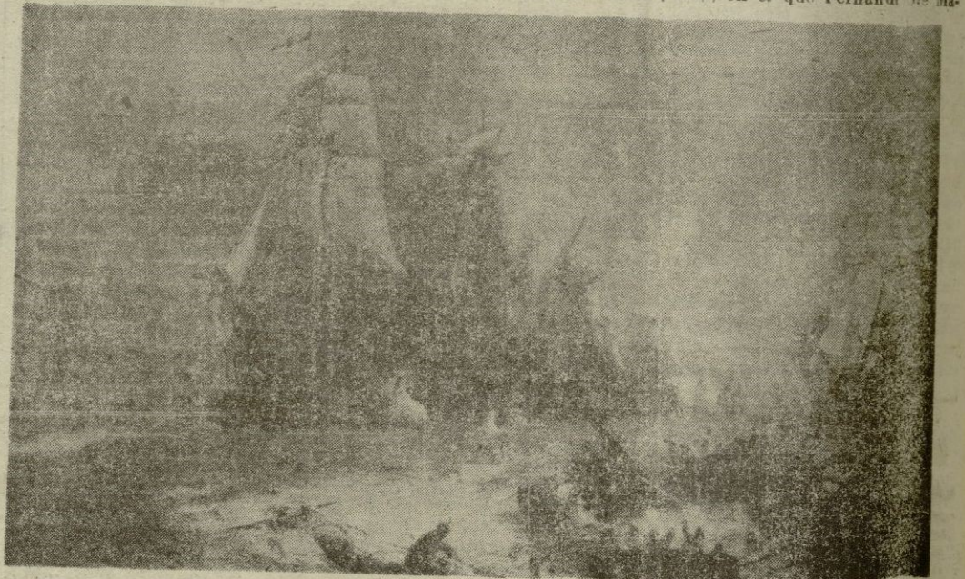
La batalla de Trafalgar

orden cronológico de los hechos, tenemos también un octubre de 1529, en el que Fernando de Ma-