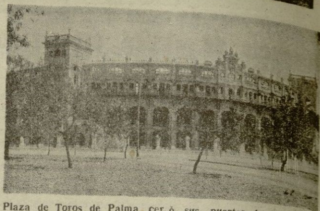
La Plaza de Toros de Palma cerjó sus puertas, hasta la próxima primavera. El fresquillo impidió la corrida del cerrojazo

Porque la temperatura se ha opuesto.-450 pesetas se comen--en paja, avena y habas--todos los días, los toros de lidia en los corrales del Coliseo Balear