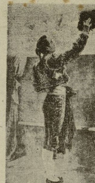
Rafael Molina (Lagartijo)

Las luchas de rea-j-mos, carlistos, republicanismos y demás (Continúa en octava página)