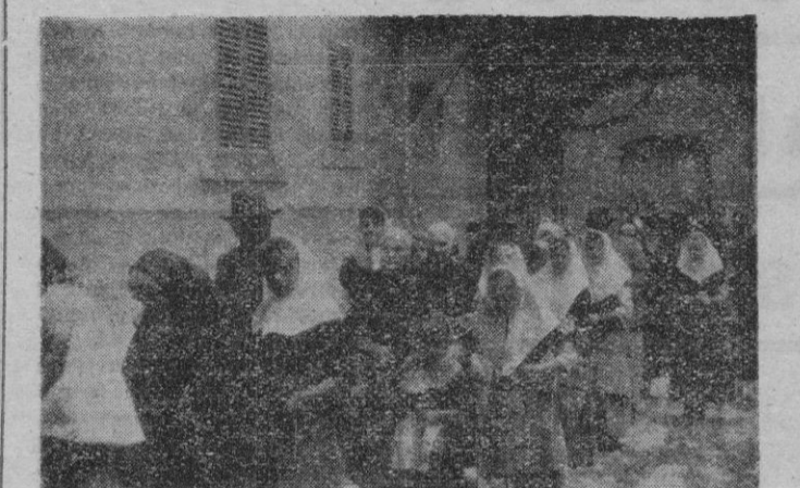
Así captó nuestro fotógrafo Sans, uno de los solemnes momentos del VIII homenaje a la Vejez.