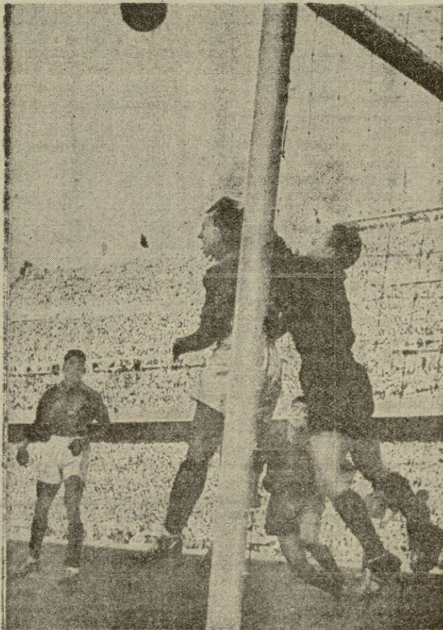
En los pocos momentos de acoso español, Remetter, bien protegido por el veterano Marche, resolvió, sin excesivos apuros, los contados tiros que fueron a su puerta