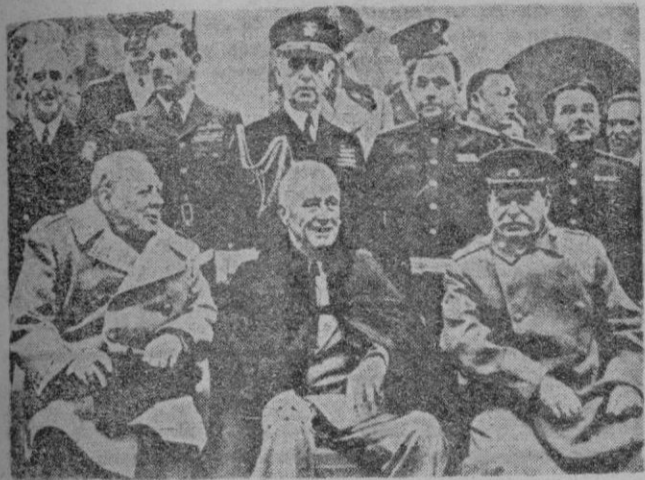
Los "tres grandes" —Roosevelt, Churchill y Stalin— reunidos en el palacio de Livadia, en Yalta (Crimea), para convenir, en servicio de la Rusia comunista, un viraje funesto en la Historia de la Humanidad

Roosevelt y Churchill que sus consejeros —Alger Hiss, el perjuro, entre ellos— y sus técnicos, se dejaron ganar por su odio a Alemania y, sobre todo, por su confianza —una absurda confianza que se explica con sólo pensar en los desvíos para la verdad y las razones de España— respecto a