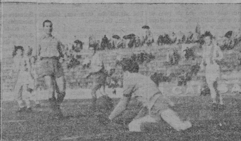
El "objetivo" de nuestro "Juanet" consiguió captar el momento en que el remate de Muñoz, se convierte en el cuarto gol para los mallorquistas. Y en la otra, Salom deteniendo un balón que rondaba por sus dominios