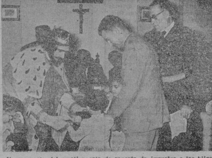
Un momento del emotivo acto de reparto de juguetes a los hijos de los presos.