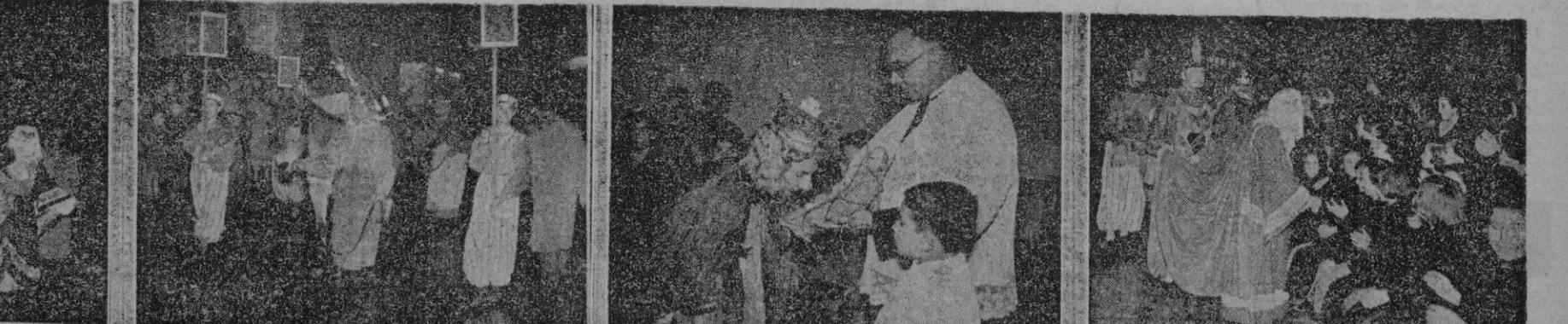
Este es un cortometraje de la Cabalgata de los Reyes Magos en su llegada a Palma y desfile por las calles de la capital. La lluvia no afectó la cabalgata de los Magos, brillante y seguida con emoción por la gente menuda. En nuestras fotos aparecen diversos actos de la llegada de SS. MM.