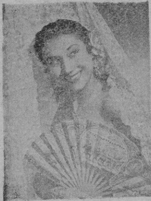
FINA DE GRANADA

Interviniendo las primeras figuras, no puede estar ausente Fina de Granada, la artista que en género español ha conquistado a toda la ciudad. Hoy por hoy, Fina puede codearse con las primeras figuras del género. Lo demostrará en la Fiesta organizada por los periodistas en el "Hotel Mediterráneo", como lo hace a diario en "Ibiza".