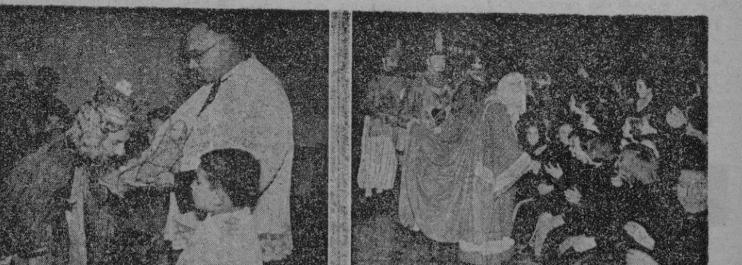
Este es un cortometraje de la Cabalgata de los Reyes Magos en su llegada a Palma y desfile por las calles de la capital. La lluvia no afectó la cabalgata de los Magos, brillante y seguida con emoción por la gente menuda. En nuestras fotos aparecen diversos actos de la llegada de SS. MM.