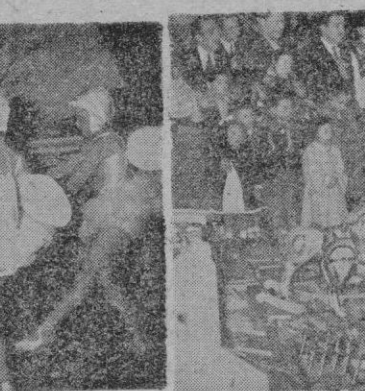
Dos momentos de la Fiesta de Reyes de BALEARES.—(Foto Juanet)

Y comenzó el escrutinio, rápido, de los boletos enviados por los niños. Por un equipo de altavoces se iban dando los nombres de los boletos que habían acertado y sus