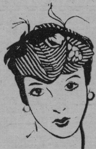
dable la moda del pelo excesivamente corto.

Estos cabellos soportan mejor que los secos las permanentes y los tintes.