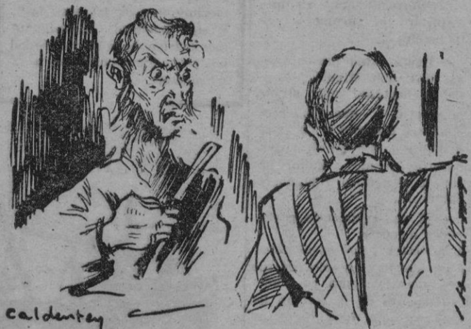
Calderer ... Un hombre rubio con el pelo largo y grandes patillas y en cuyos ojos había una expresión de terror y desesperación como yo nunca había visto en mi vida...

—Como iba diciendo —continuó el del bigotito endebte—; me despedí de mi compañero de colegio y olvidé por algún tiempo la trágica historia que me había referido. Pero resultó que en cierta ocasión la firma para la que trabajo me envió a... —bien, no mencionaré el nombre de la población— y me encontré con que tenía reservadas mis habitaciones en el mismo hotel del desdichado Tobias Lane. Si hubiera sabido lo que iba a sucederme, me hubiera trasladado, pero en aquellos tiempos yo también era un escéptico,