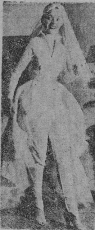
Esta novia está dispuesta a llevar los pantalones desde el primer momento en su hogar. Para ello, ha secundado la moda que ha lanzado un modisto de Nueva Gales y se ha presentado a su boda vestida de este modo. Pues, nada, señora, que se imponga usted mucho a su marido que le ha consentido vestirse así

de la organización de la protección del mundo libre.”—Efe.