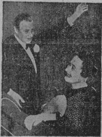
Los Duques de Windsor bebieron demasiado en Capri.

nes y autobuses y que por un día o dos abandona su añosa y soleada ciudad para consagrarse a la gastronomía campestre, no sabe-