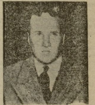
Henry Ford, cuyas industrias del automóvil pueden verse amenazadas por una crisis de compradores.

Quizá sea impropio hablar de la concentración de la pugna internacional entre gigantes globales en la vispera en que es temido si los indios llevan a cabo sus amenazas, el choque entre la India y Portugal, por los breves y elocuentes territorios en el subcontinente asiático.