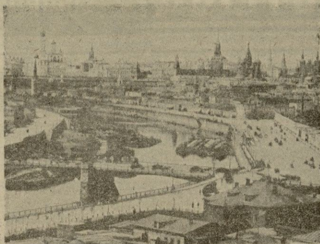
Una vista parcial de Moscú, con el Kremlin al fondo