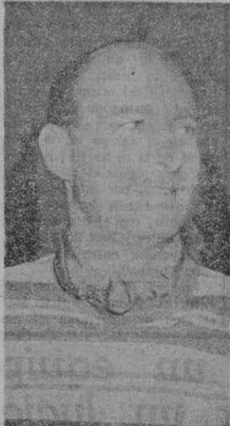
ALFREDO MAYO sin maquillajes, tan necesarios en los artistas cinematográficos.