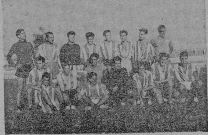
En el grupo obtenido por "Juaner", ayer tarde en "Son Canals", figuran la totalidad de jugadores que asistieron al primer entrenamiento de la temporada

El Trío de ayer 8-3-2 se pagó 516 ptas. y la Dupleta 5-2-1-2 a Ptas. 189.