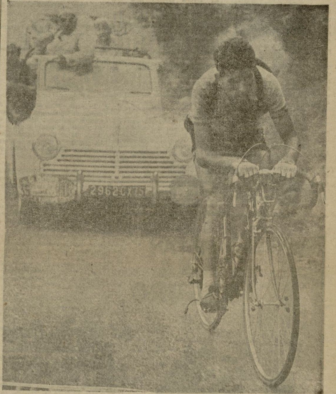
Bahamontes, el mejor escalador que ha tenido España en todos los tiempos escalando valientemente la montaña más alta de los Alpes. Tras él, el coche del director español Julián Berrrendero, a quien vemos en primera posición, con sus gafas negras y con su megáfono. El coche que han empleado este año los directores de equipo ha sido un "Peugeot" desca potable tipo 203. Véase en el pachoques, a la izquierda, el número del vehículo (35) y a la derecha los colores de España. Obsérvese también que la máquina de Bahamontes está aligeradísima de peso, pues no lleva siquiera un bidón