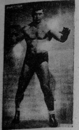
GUETTIER francés, actual campeón de Europa.