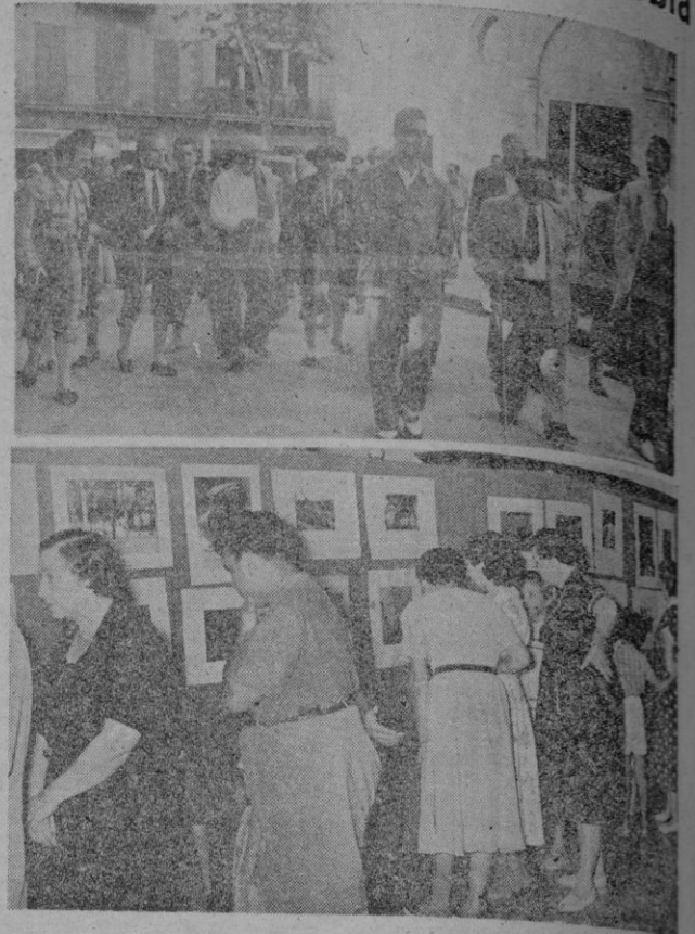
Dos instantáneas de las brillantes fiestas en La Puebla. La primera, la que figura el Alacide, capta el desfile antes de dar comienzo a la corrida. — En la foto inferior, un detalle de la interesante exposición fotográfica inaugurada en los salones de la Caja de Pensiones