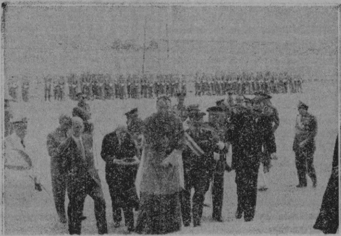
Las primeras autoridades entrando en la Parroquia de Santa Catalina Thomas, en donde se celebró la Misa que el Grupo de Automovilismo dedicó a su Santo Patrón.

asistieron a un festival deportivo, que resultó interesantísimo. Consistió en varias carreras ciclistas y de velomotores, que fueron reñidísimas y causaron el regocijo y el entusiasmo de los pequeños. Al finalizar las pruebas deportivas, se realizó la entrega de trofeos a los vencedores.