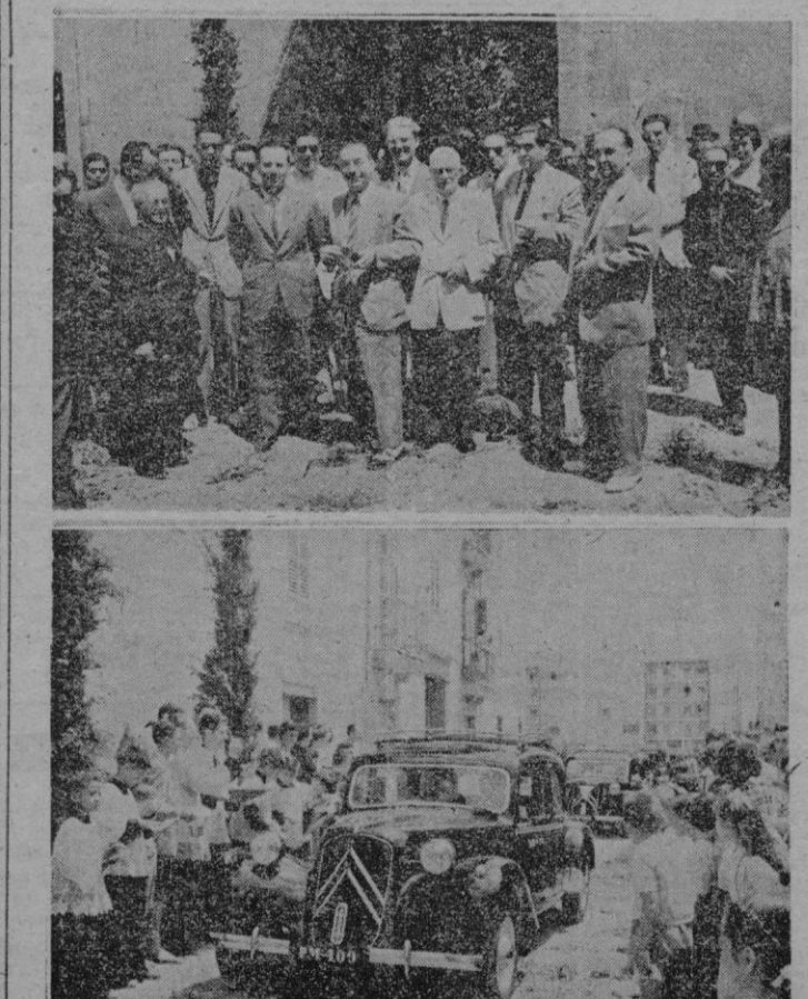
Las jerarquías sindicales y productores del Sindicato de Transportes a la salida de la misa celebrada en la iglesia de Santa Fe. — En la otra foto, un momento de la tradicional bendición de coches