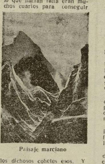
Paisaje marciano los dichosos cohetes esos. Y

N ADA. Que no cejan los científicos en darle vueltas al asunto de los viajes interplanetarios. Acaba de celebrarse en Nueva York el Congreso de Sabios que estudian las posibilidades de un viaje a la Luna o Marte. Unos quinientos hombres de ciencia han acudido a ese Congreso donde se han hecho afirmaciones categóricas de que todo es posible para llegar a la Luna. Según Mr. Arthur Clarke, uno de los grandes sabios allí congregados, con la energía liberada de una bomba de hidrógeno podrían moverse 10 proyectiles tan grandes cada uno como el "Queen Elizabeth" desde la Tierra a la Luna y regreso. Allí se ha hablado muy en serio. Cada cual exponía sus teorías. El más sensato, sin duda, fué el que dijo que todo eso estaba muy bien, pero que