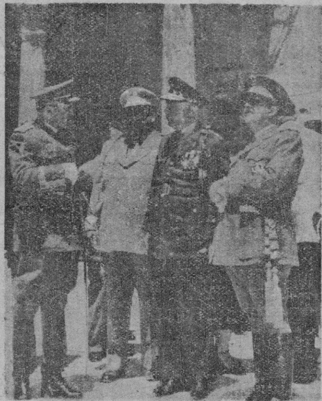
S. E. el Jefe del Estado español y el Generalísimo Trujillo, visitan las ruinas del glorioso Alcazar de Toledo, acompañados del Teniente General Moscardó, su heroico defensor

FRANCO Y TRUJILLO VISITAN EL ALCAZAR DE TOLEDO