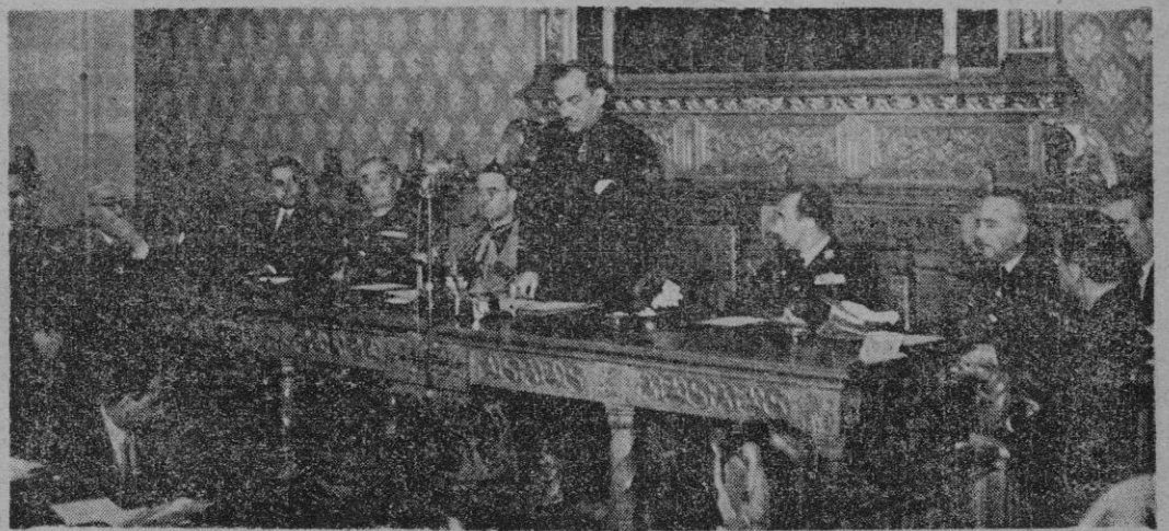
Un momento del discurso pronunciado ayer por el Gobernador Civil y Jefe Provincial, camarada Honorato Martín Cobos en la solemne sesión de clausura del I Consejo Económico Sindical de Baleares (LEA INFORMACION EN QUINTA PAGINA)