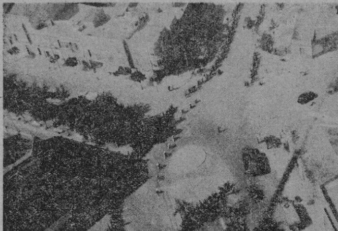
Las avionetas del Real Aero Club de Baleares no cesan de volar sobre los "gigantes de la ruta" de la XII Vuelta Ciclista a Mallorca. Y siguen obteniendo buenas fotos. Esta tiene ya sabor urbano: el paso de "la serpiente multicolor" por las Avenidas, en Palma