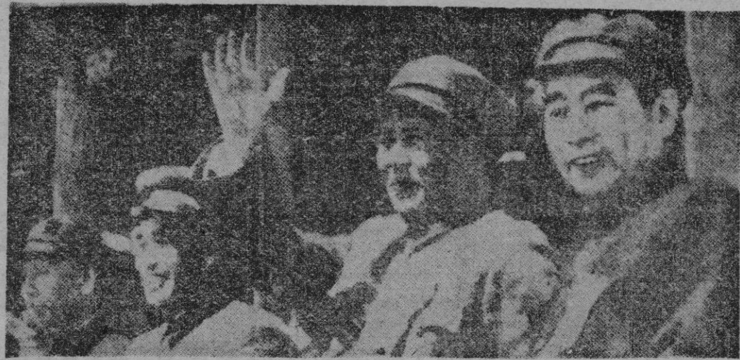
He aquí los cuatro temibles grandes de la China roja: en el centro, Mao Tse Tung, levantando la mano; a su izquierda, Chou En Lai, ministro de Asuntos Exteriores, y a su derecha, Chu Teh, jefe supremo del Ejército, y Lin Shao Chi, vicepresidente del Politburó, que preside Mao.

Esta es la esperanza del Tibet, pero resulta aventurado predecir su triunfo, ya que la acción china está transformando la estructura social del país. Por de pronto, ya se ha anunciado que colonias de campesinos chinos van a ser llevadas para darles en propiedad parcelas de tierra tibetana en la que ahora ondea, amenazadora, la bandera comunista.