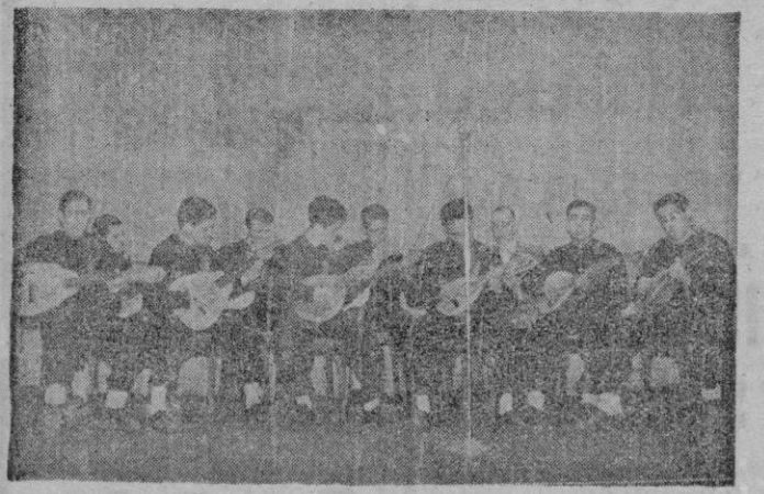
Rondalla del F. de J. de Palma

del Frente de Juventudes: El aprendizaje español no existía antes como factor social en la vida de España, pero la Jefatura Central de Trabajo orientó su actividad a lograr que el mayor número posible... (Continúa en sexta pág.)