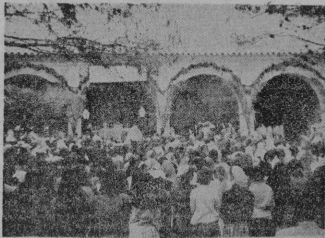
El momento de la solemne misa

tuario para el acto recreativo. Esta reunión íntima de las ex-alumnas resultó deliciosa. Actuaron las de Pina, con un canto escogido, Muro y Calle Antillón, con un recital magnífico, Campos y La Puebla, con sus sajetes y chistes, salpicados de humor y para finalizar