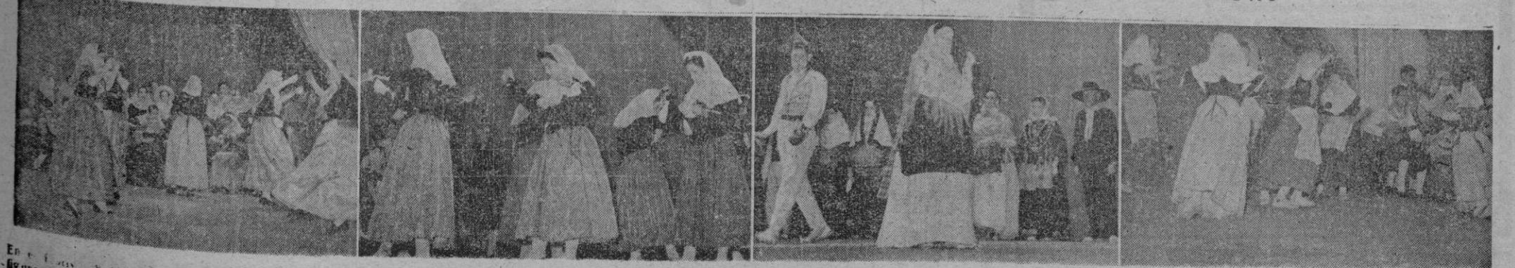
En el concurso de danzas y canciones, organizado por la Sección Femenina — tan atenta a las más genuinas expresiones artísticas de nuestro pueblo — fué captado ese reportaje y aficio en que figuran los conjuntos — de izquierda a derecha — de Palma, Menorca, Ibiza y Felanitx. Todos ellos, entre otros, tuvieron importantes y sugestivas intervenciones en este conjunto cuyo resultado damos en páginas interiores.