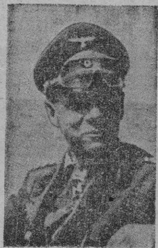
Rommel, cuyo famoso tesoro es buscado por muchos aventureros

Las minas de Choconta, que fueron abandonadas por los españoles