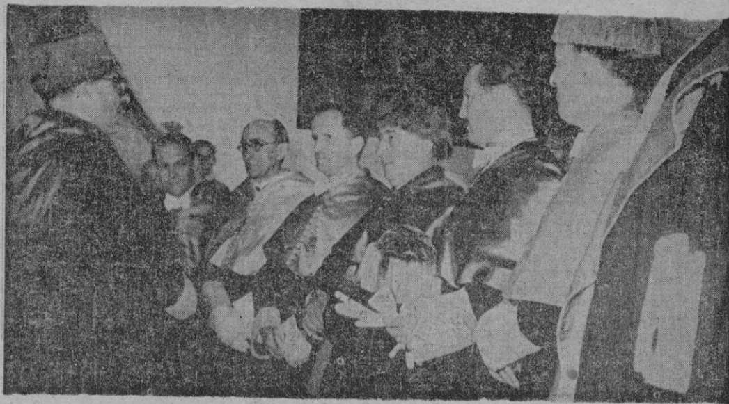
SALAMANCA.—S. E. el Jefe del Estado Generalísimo Franco después de su investidura, ocupa el estrado al lado de los demás doctores.