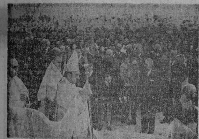
Millares de feligreses se reunieron el domingo en torno de nuestro amado Prelado que, en una fiesta de gozo para el espíritu, bendijo la nueva iglesia parroquial dedicada a Santa Catalina Thomas, en el Ensanche. El lector hallará amplia reseña en este número.