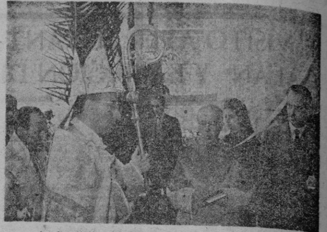
La bendición del templo por el Obispo de Mallorca