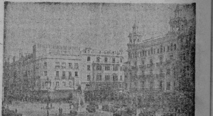
La plaza del Gran Capitán en Córdoba.

Hablan las cifras con su exactitud precisa para que no haya