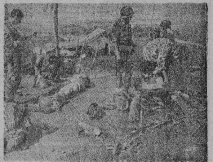
Esta fotografía nos muestra un aspecto de la dramática lucha que se desarrolla en Dien-Bien-Fu, llamado por los franceses "el Verdun de Extremo Oriente". Heridos a centenares que solo pueden ser evacuados en helicóptero, son atendidos en medio del infernal fuego que cesa sobre la posición defendida en su mayoría por alemanes voluntarios de la Legión Extranjera francesa