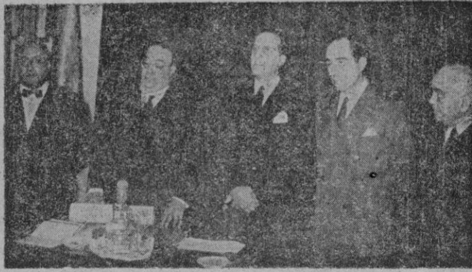
Madrid.—El Ministro de Información y Turismo con el Subsecretario de Asuntos Exteriores y Director General de Prensa, en el acto de imponer la Gran Cruz de Isabel la Católica al Director de la United Press, señor Forte.