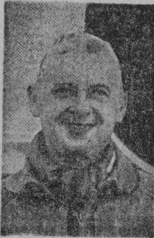
La última foto del Coronel Rozanoff

10.000 metros, en vertical sobre la pista.