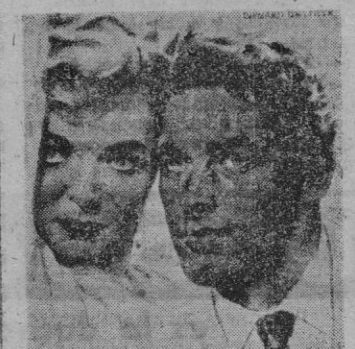
Los protagonistas del film.

El film, bien intencionado y nada mal hecho, cuenta una serie de casos de ex combatientes y sus problemas de adaptación a la nueva vida, es decir, a la normalidad.