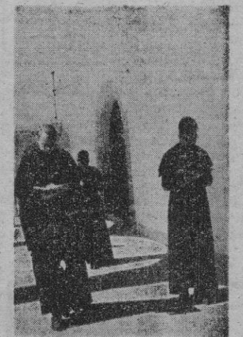
La hora del estudio, paseando por las soleadas galerías.