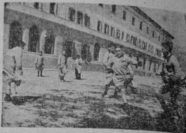
Y la alegre hora del recreo, en la que se improvisa un apasionado partido de fútbol.

A las cinco y cuarenta y cinco minutos tiene lugar la última clase del