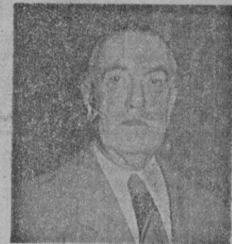
CONDE DE VALLELLANO

Cartagena, 6.— El Ayuntamiento en pleno ha acordado conceder la medalla de oro de la ciudad, al Ministro de Obras Públicas, Conde de Vallellano, por la labor realizada en beneficio de los intereses de la ciudad. — Efe.