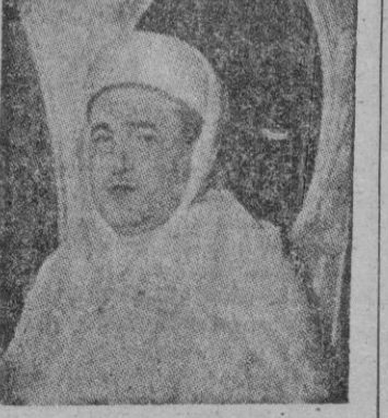
Mohamed V, legítimo Sultán de Marruecos