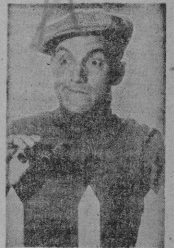
El actor argentino "Palitos" termina esta noche, desde el escenario del Principal, su actual gira por España.

«PALITOS», y su última actuación en España