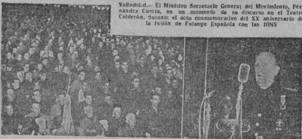
Valladolid.— El Ministro Secretario General del Movimiento, Fernández Cuesta, en un momento de su discurso en el Teatro Calderón, durante el acto conmemorativo del XX aniversario de la fusión de Falange Española con las JONS