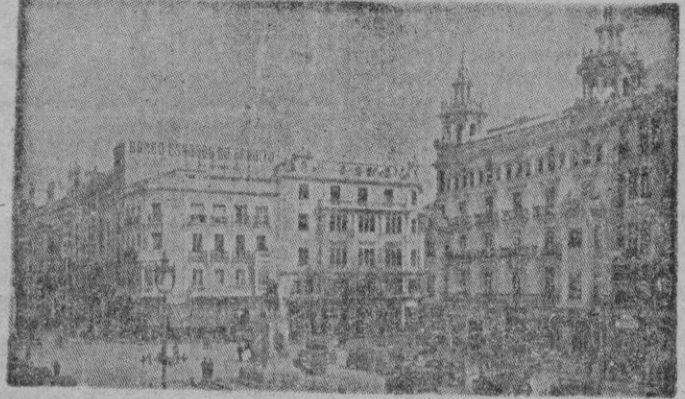
Córdoba. Plaza del Gran Capitán

El Ayuntamiento de Córdoba se prepara a recibir, en una magna sesión académica el máximo galardón a que pueden aspirar los Municipios en el orden de la cultura. El de obtener la Medalla de Oro que otorga anualmente la Real Academia de Bellas Artes de San Fernando.