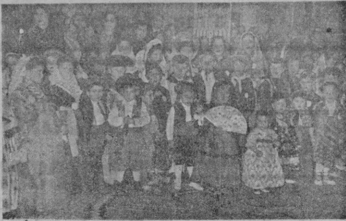
Un simpático grupo de pequeños asistentes a la fiesta infantil del Club Náutico, celebrada el domingo, y que resultó muy alegre y vistosa.