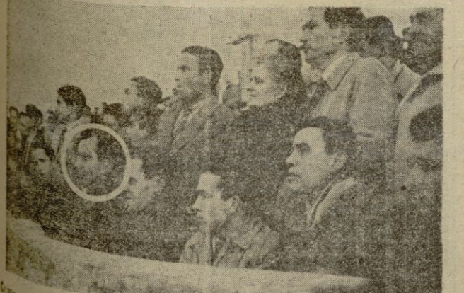
Como ya es costumbre, la directiva del "Manacor" regala una localidad a los asistentes al campo de "Na Capellera" a través de las columnas de "BALEARES". El señor que figura en el círculo podrá asistir al partido del próximo domingo entre el Manacor y el Badia para ello basta que se persone en la secretaría del C. D. Manacor.