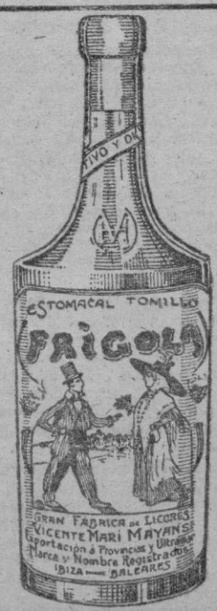
LICOR DE ALIA CALIDAD

SALLISTA 3 — POBLENSE 2 Nos faltó, a última hora, la información que debíamos recibir de Inca. Mañana ofreceremos a nuestros lector, esta crónica para completar la jornada, muy ruidosa por cierto, del domingo.