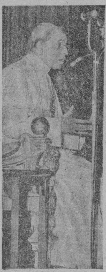
S. S. el Papa

"La evolución moderna de la Medicina ha seguido últimamente rumbos inesperados que, en cierto modo, justifican la teoría homeopática... Me refiero precisamente a las cuatro ramas más características e importantes de la (Continúa en la pág. sig.)