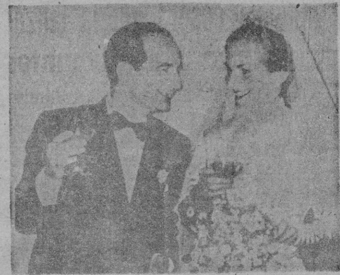
Don José Figueres —hijo de catalanes— Presidente de Costa Rica, ha contraído matrimonio con doña Rita Karen Olsen. En la foto, los desposados momentos después de la ceremonia nupcial