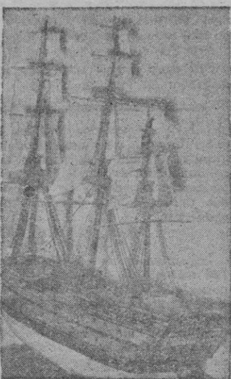
Las fragatas y navios alcanzaron renombre con Jorge Juan

La historia de la construcción naval primitiva se puede seguir en las características de las embarcaciones que utilizan murhas de las razas actuales del Pacífico. Son unas gentes que hasta hace poco vivían su Edad de Piedra. La embarcación aparece en el neolítico, según ha demostrado la investigación. En el Eufrates fueron usados el pellejo u odre lleno de aire y el cesto recubierto de asfalto. También el tronco, ahuecado rudimentariamente, constituyó una de las primitivas embarcaciones. Según informan documentos sobre esta materia, "las excavaciones de Sumeria y Arcadia, los relieves babilónicos y egipcios, y hasta las tumbas reales, permiten, cada vez más, seguir los pasos del progreso de la nave, mejor aún, de la embarcación primitiva".