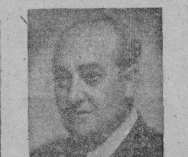
poeta independiente de ismos y fiel a una especie de clasicismo renovado...