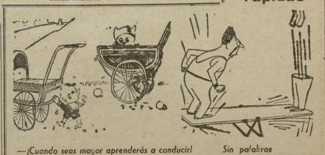
—¡Cuando seas mayor aprenderás a conducir!