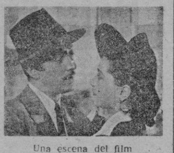
Una escena del film