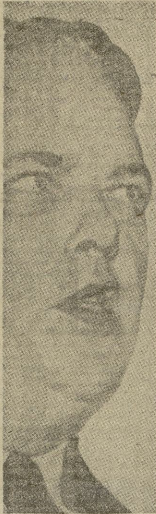
W. Chambers, que colaboró con el F. B. I. en el desmascaramiento del espía soviético Alger Hiss.

como era un detective ejemplar, también lo era y lo es como hombre. No tiene esposa, ni amistades femeninas y muy pocos amigos. Pero éstos de una hombría de bien a toda prueba. Sólo tiene una pasión: su anciana madre, la mujer que tuvo que trabajar 20 horas diarias en una América hostil a los emigrantes irlandeses para abrir camino a una familia numerosa donde no había padre porque falleció casi de hambre. Hoover vive con su madre en una casita de las afueras de Washington, con dos perros policíacos, que llama "Butch" y "G-Boy". No tiene opinión política marcada, ni ha votado jamás. No le hace ríngorras a la cocina y todos los días toma un parco menú en una modesta cafetería en unión de Clyde Tolson, su secretario y esposa.