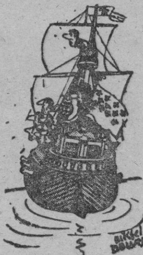
Las naos y galeones, cruzaron el camino de Indias llevando el nombre de España

En el siglo XIII aparece la galera con el espolón tomado del "rostrum" de la "liburna". En esta época las naves habían a-