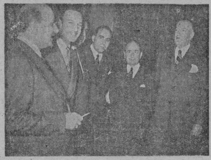
MADRID.—Un momento de la reunión constitutiva de la Junta Nacional de Homenaje a Calvo Sotelo, que fué presidida por el ministro de Obras Públicas conde de Vallellano