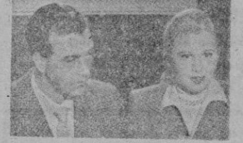
Una escena del film