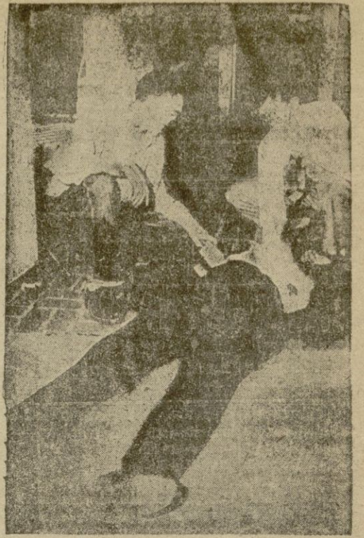
Un crimen. Intervención rápida de los agentes del F. B. I.