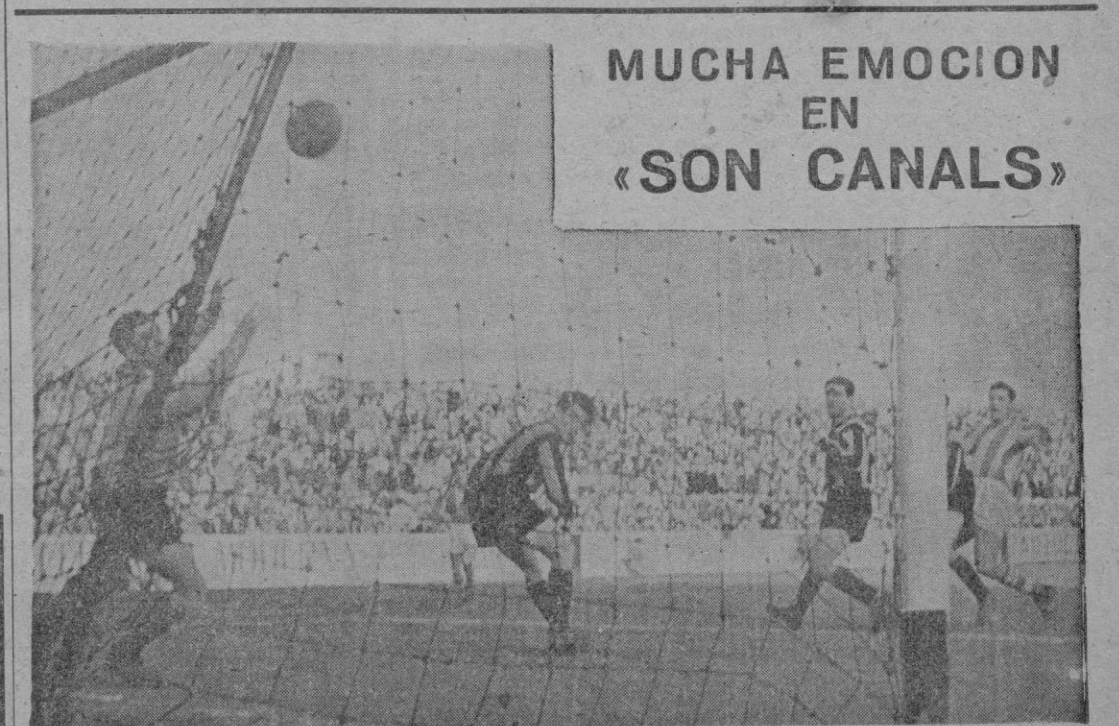
MUCHA EMOCION EN «SON CANALS»

HOY SE VENDE A 75 CENTIMOS. LOS CINCO CENTIMOS DE SOBREPRECIO SE DESTINAN A INCREMENTAR LOS FONDOS DE LA INSTITUCION SAN ISIDORO, PARA HUERTANOS DE PERIODIASIAS, EMPIEDADOS Y OBREROS