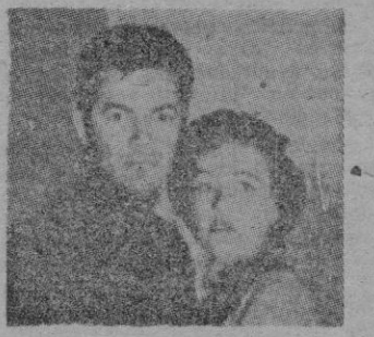
Una escena del film.