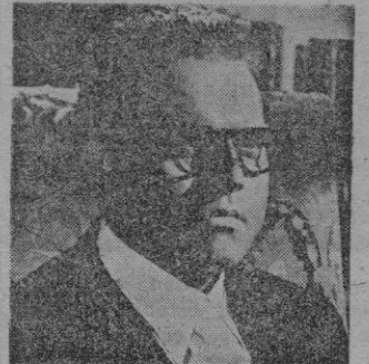
Orson Welles en su interpretación

El tema es netamente policiaco sin que lo desvirtúen unos reñidos de escenas shakespearianas entresacadas de «Otelo».