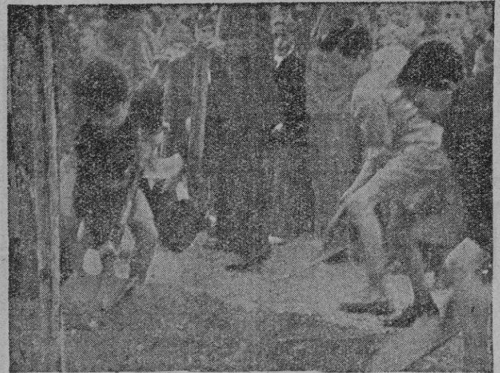
Niños de las Escuelas palmasanas en la tradicional fiesta del árbol.

Lo importante es hacer justicia social a quienes lo merecen y con jurar una situación que puede llegar a ser peligrosa para la educación primaria nacional y que en