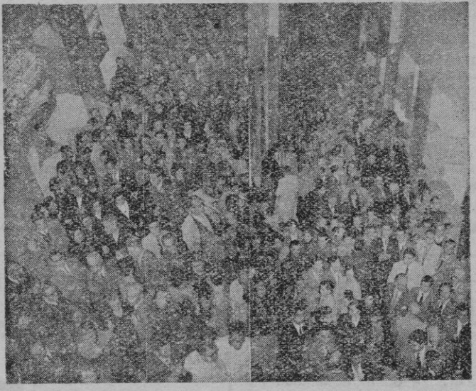
Dos aspectos de la animación que ofrecía ayer la Tómbola Virgen de Lluch, inaugurada y bendecida solemnemente por el Excmo. y Rvdmo. señor Obispo de la Diócesis, con asistencia de nuestras primeras autoridades.