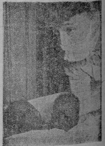
Las negritas siamesas Wariboko, en el hospital momentos antes de ser separadas quirúrgicamente.

El comunicado del Hospital no ha aclarado todavía cuál de las dos murió y cuál quedó con vida.