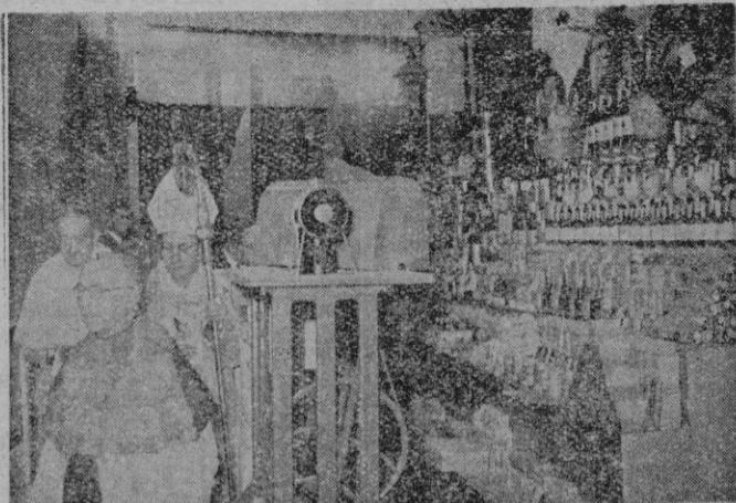
El Obispo de Mallorca en la brillante y solemne bendición de la tómbola «Virgen de Lluch», celebrada en la tarde de ayer, de la que damos amplia reseña en el interior de este número.