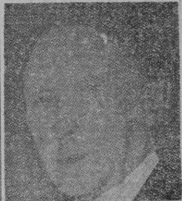
EL DOCTOR ADENAUER OPINION BELGA

BELGICA Y LA DEFENSA DE EUROPA Bruselas, 26.—La cámara de diputados belga ha aprobado hoy la ratificación del tratado de comunidad europea de defensa por mayoría abrumadora de votos. La cámara dejó a un lado las diferencias de partido y aprobó el tratado por 148 votos contra 49 y 3 abstenciones.—Efe.