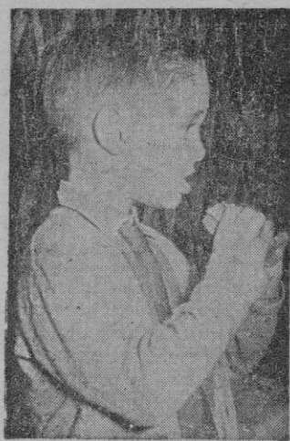
Es la hora de la merienda, hora en la que este chico mallorquin conoce de los múltiples idiomas de sus compañeros de curso