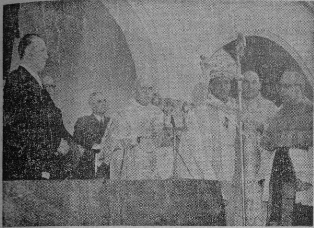
Instantánea del solemne momento de la bendición, por el Obispo, del nuevo Seminario Menor.