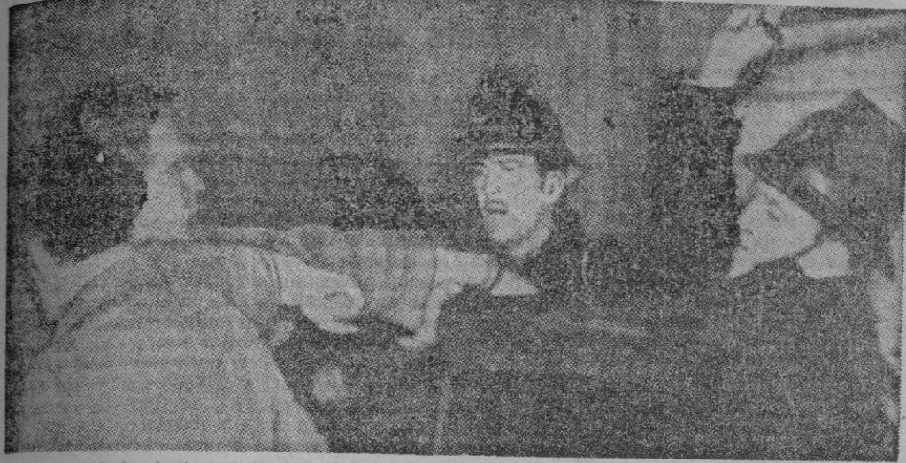
Después de decir los ingleses a los italianos que les devolvían la zona "A" de Trieste, la policía británica la emprende a palos con los patriotas italianos que protestan por la permanencia en el "vindicado" territorio triestino, de los soldados de la Rubia Albion, que deberían irse según lo acordado. Trieste, igual a embrollo político del que no saben como salir los anglo-americanos. En tanto, palos por doquier. Una bonita paz, si señores, producto de la mentalidad y "genio" político de Churchill