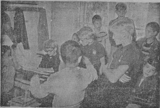
Un breve descanso entre clase y clase en el colegio más cosmopolita de Mallorca, emplazado en el Terreno, sobre el mar y entre la pineda

Tanto los toxicómanos como los contrabandistas se han distanciado siempre por su afán de ganancia en el arte de pasar mercancía por las casi infranqueables barreras aduaneras. En el Museo de la Aduana de Nueva York se exhiben realmente ingeniosos. Uno de ellos consiste en un zarzo entre cuyas setas, de doble sentido, se escondían cantidades de opio por valor de unos diez mil dólares. Doce días de espera en el empujón de la aduana (Continúa en sexta página)