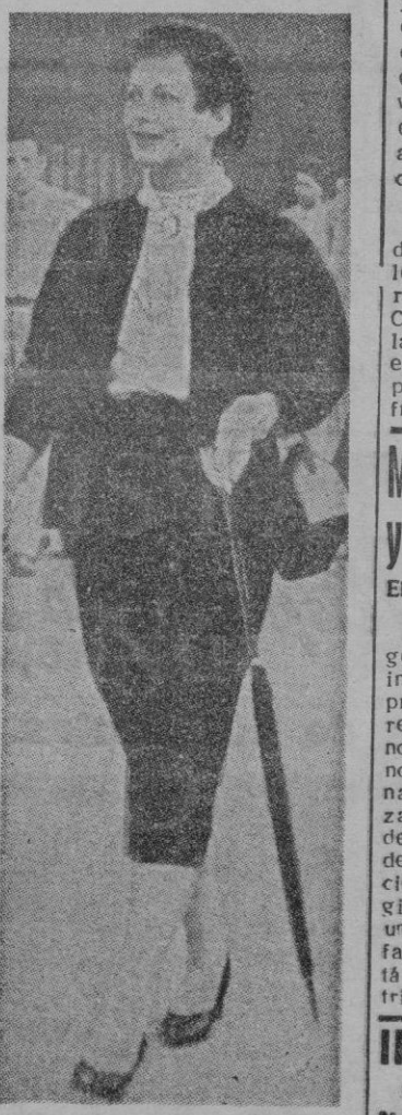
He aquí a la "estrella" Hedy Lamarr, paseando por las calles de Roma. Obediente a los dictados del último emperador de la m.d., Hedy, la que pudo con Sansón, se ha cortado la propia melena y, esta es la verdad, s'igue muy guapa Hedy, muy guapa.