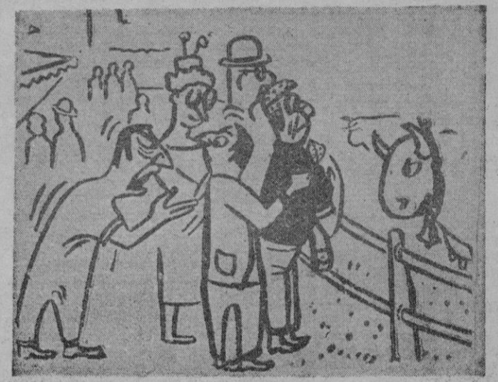
FERIA DEL CAMPO —¡Yo creo que porque sean extranjeros no hace falta que les expliques tanto lo que es una vaca!

BORNE arriba, BORNE, abajo MALA SUERTE Un matrimonio que realizaba un viaje, pasó unos días en Montecarlo. El marido llevó a la esposa al Gran Casino, y una vez allí, dándole un billete de diez mil francos, le dijo: —Toma, querida, quiero que pruebes tu suerte en la ruleta. —Pero, ¿a qué número lo juego? —preguntó ella indecisa. —Juégalo al número de los