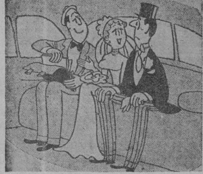
—Caballero, ¿quiere examinar tres interesantes propuestas de seguros de vida?

BORNE arriba, BORNE, abajo MALA SUERTE Un matrimonio que realizaba un viaje, pasó unos días en Montecarlo. El marido llevó a la esposa al Gran Casino, y una vez allí, dándole un billete de diez mil francos, le dijo: —Toma, querida, quiero que pruebes tu suerte en la ruleta. —Pero, ¿a qué número lo juego? —preguntó ella indecisa. —Juégalo al número de los