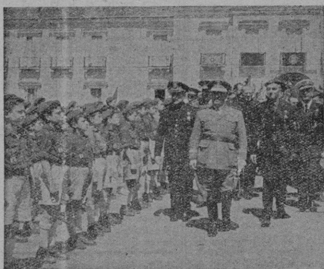
MADRID. — S. E. el Jefe del Estado acompañado del Delegado Nacional del Frente de Juventudes pasa revista a los 5.000 muchachos de las Falanges Juveniles que se concentraron en el Palacio de El Pardo para asistir a la ceremonia de entrega del nombramiento de Alcalde de Móstoles y bastón de mando de dicha villa al Caudillo.

por el R.P.F., degaullistas y los radical-socialistas. Los candidatos de la coalición francesa se han apartado cuando no se han opuesto francamente al programa de reformas patrocinado por Franco y destinado a aplazar la agitación nacionalista. — Efe. — * — Túnez.— De los catorce dirigentes tuneños detenidos la madrugada pasada, tres son comunistas y once de neo-déstour. También son nacionalistas los dos políticos vigilados en sus domicilios. No se sabe el tiempo que durará el confinamiento de los dos primeros en el desierto. La huelga general constituyó un fracaso el domingo, en razón a que la mayor parte de las oficinas y comercios no abrieron sus puertas. Los tranvías y autobuses funcionaron normalmente. (Continúa en sexta página)