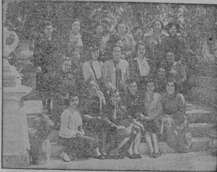
Días pasado, tuvo lugar en Son Bono, y organizado por la Sección Femenina un curso para enlaces sindicales, al que pertenece esta foto.