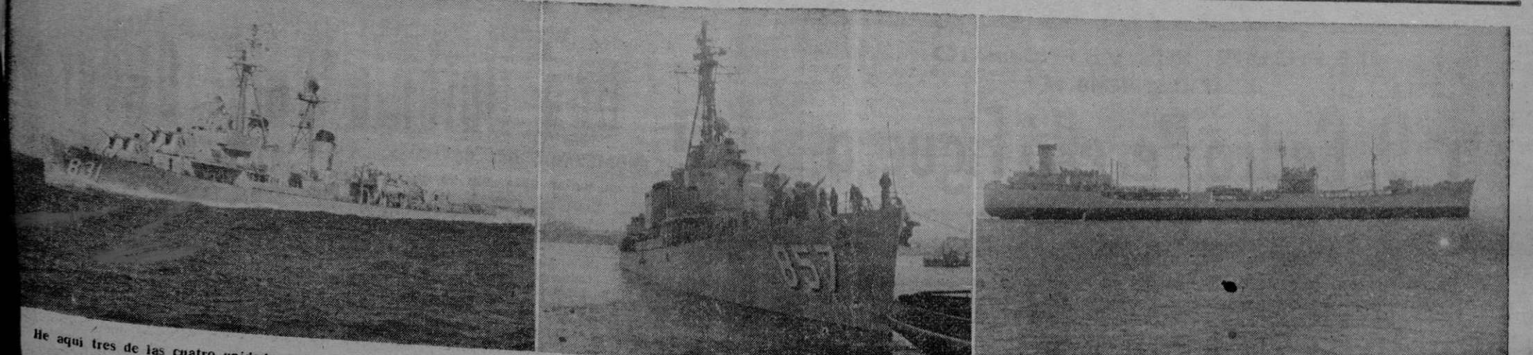
He aquí tres de las cuatro unidades norteamericanas que en la mañana de hoy, llegan a nuestro puerto: Los destructores "Godrich" y "Bristol" y el petrolero "Marias". Sean bienvenidos los marinos americanos a nuestra tierra.