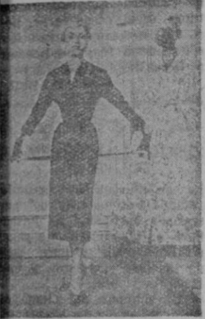
Modelo de Christian Dior