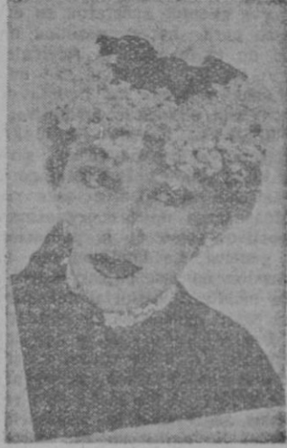
Toca de piqué blanco de Albonny. Paris

del busto femenino. Dior abriéndola en forma de tulipán. Los dos dándole a la mujer un aspecto sano, juvenil, muy femenino y fragante).