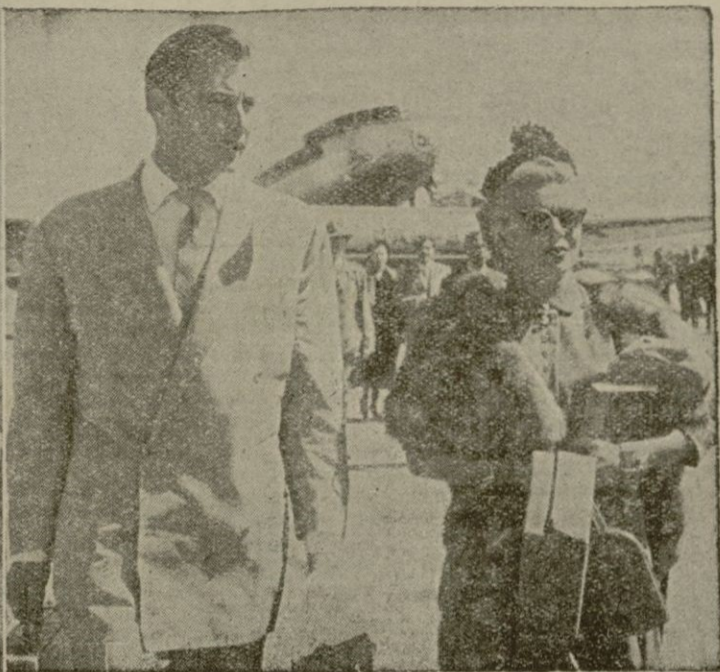
Lana Turner en alpargatas llegó al aeropuerto de Son Bonet de Lana Turner junto al también actor cinematográfico Lex Barker.

actriz escoltada por Lex Barker-el último... pasarán unos días bucólicos en la isla