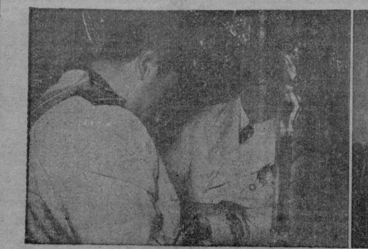
El Ministro durante su discurso, en el Estudio General Luliano, la mañana del domingo; momento de la imposición de la Medalla del Mérito Civil a nuestro Gobernador Civil y Jefe Provincial, y la presidencia del acto con las primeras autoridades asistentes.