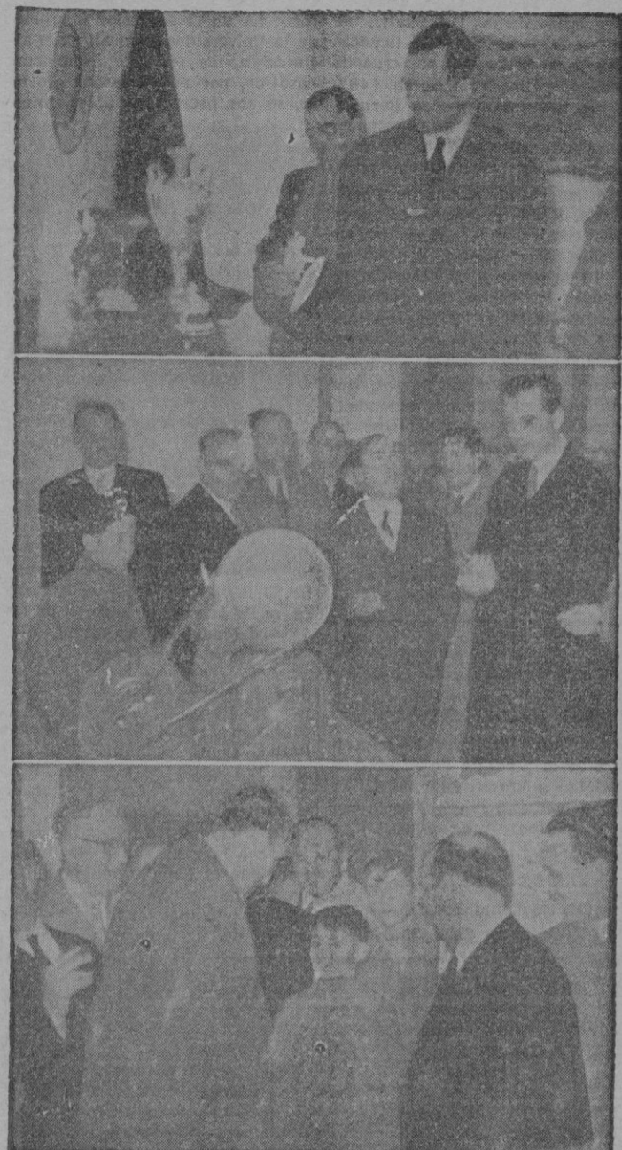
Diversos momentos de la visita del Ministro al centro laboral felanitense. — (Fotos Juanet)

El grito patriótico de nuestro Gobernador fué contestado entusiásticamente por la concurrencia, que aplaudió también calurosamente el hermoso párrafo del señor Rodríguez de Valcárcel. Este, a continuación, hizo entrega al Ministro de un ejemplar, bellamente encuadernado, del Plan de Ordenación Cultural de la Provincia. DISCURSO DEL MINISTRO DE EDUCACION NACIONAL Excmos. Sres., amigos: Si ser español es una de las pocas cosas serias que se pueden ser en la vida, ser mediterráneo es una de las pocas cosas que quedan por ser en Europa. Por eso, camarada y amigo, Alejandro Rodríguez de Valcárcel, por ser capitán hoy en este navio que tiene nombre secularmente glorioso, y noblemente glorioso después de una epopeya de nuestra Cruzada, el navio «Ba eares» tienes una gran empresa a realizar. Te felicito más; mucho más que por recibir esa condecoración, con la que el Gobierno de España, el Jefe del Estado, tu Caudillo, nuestro Caudillo, ha querido premiar tus servicios como Gobernador ya durante muchos años, te felicito—digo—más que por lo pasado, por la Continúa en la página siguiente