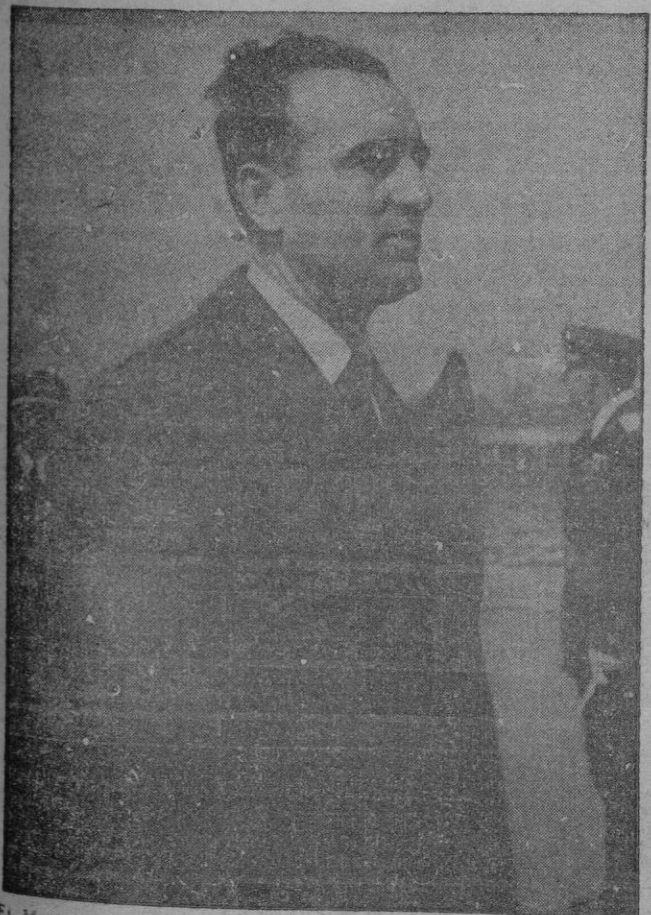
El Ministro a los pocos minutos de su llegada al aeropuerto de Son Bonet.

Entrega al Sr. Ruiz Jimenez del Plan de Ordenación Cultural