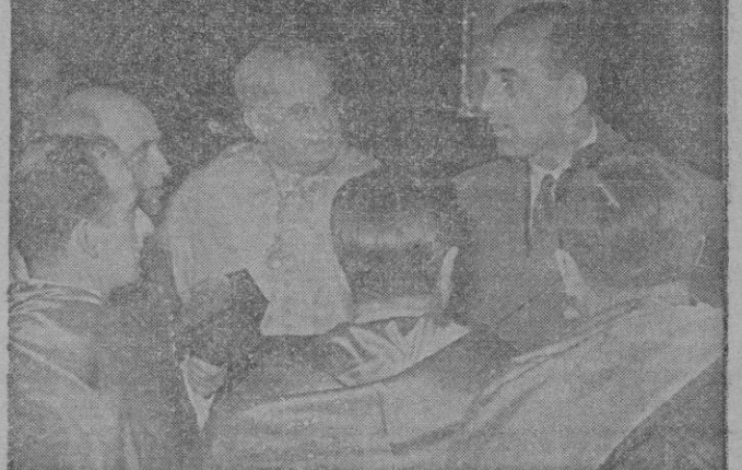
En la jornada del lunes, el Ministro de Educación Nacional en su visita a diversos centros docentes.