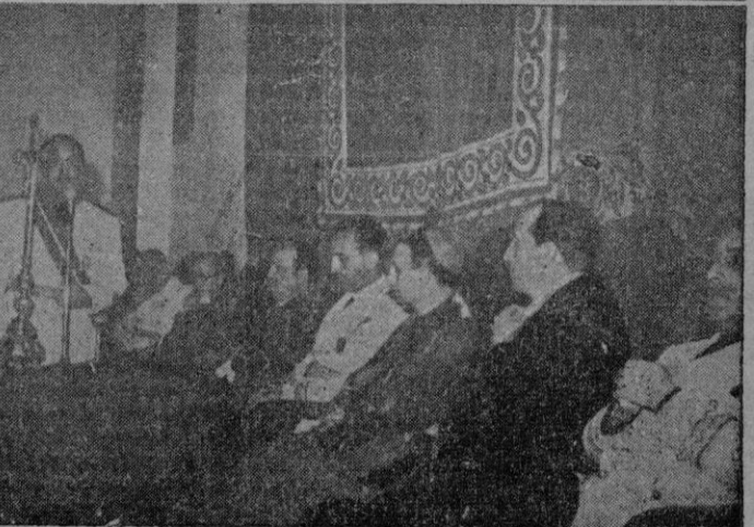
El Ministro durante su discurso, en el Estudio General Luliano, la mañana del domingo; momento de la imposición de la Medalla del Mérito Civil a nuestro Gobernador Civil y Jefe Provincial, y la presidencia del acto con las primeras autoridades asistentes.

ARDE una bandera soviética LA HABIAN PRENDIDO FUEGO LOS BERLINESES DEL SECTOR NOROCCIDENTAL Berlin 9.— Varios centenares de berlineses occidentales han prendido fuego hoy a una bandera soviética de la que se apoyaron en la sede del partido comunista en el sector noroccidental. Los comunistas habían desplegado su bandera roja en señal de pesar por la muerte de Stalin.—Efe.