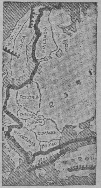
El telón de acero sustituye al champagne de Georgia.

¿QUE HABIA PASADO EN LA CONFERENCIA DE YALTA? Nos situamos en el aeródromo ruso de Saki, Alii Molotov, Stettinius y Averell Harriman, y la guardia de honor del ejército rojo con banda militar, Cuando el aparato que conduce a Roosevelt toma tierra, las notas de "The Star Spangled Banner", "Good save the King" y "La Internacional", caldean el ambiente.