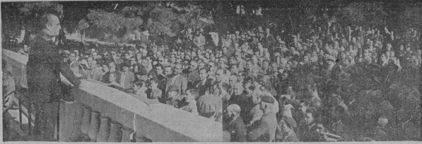
El Excmo. Sr. Gobernador Civil y Jefe Provincial del Movimiento, camarada Rodríguez de Valcárcel, durante su vibrante discurso pronunciado ante la concentración del domingo, en Porto-Cristo, organizada por la Falange de Manacor. (Amplia información en el interior de éste número.

En un futuro próximo, pues, las gallinas quedarán incorporadas a