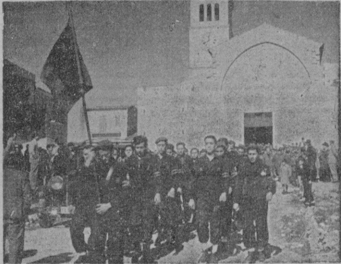
El Frente de Juventudes presente en la concentración.

« H AY QUE gritarle al aire, y al sol...» — repetía el jefe en su alocución a la Falange comarcal de Manacor en aquel bosquecillo de pinos de su Puerto de mar—. Y es que se estaba, "allí estábamos", en pura transparencia de cosas y de doctrina. ¡Maravillosa Mallorca, urna de cristal y luz, que en la rueda del tiempo —fala, fala— cuando en otras latitudes el lino con que se tejen las horas está húmedo y como podrido y lo cortan los vientos, en ella está seco de sol y se desliza suave como un len de seda entre los dedos de las jóvenes hilanderas del Olimpo! ¡El mar, ese labio húmedo y suave que como en boca de pez besa el entero contorno de la Isla, anteaer era como una malla de plata rebrillante al sol! ¡Y el perfume del bosque, ese óleo aceitoso de la resina que también el sol abría en los verdes pebeteros de los pinos, lo aspiraba el olfato y semejava impregnar, como en un curioso fenómeno de endósmosis, los demás sentidos! Atrás, en la larga llanada de Manacor al Puerto —que lejos en el tiempo contemplábamos los cercanos picachos de Son Corp, Son Mancho, las