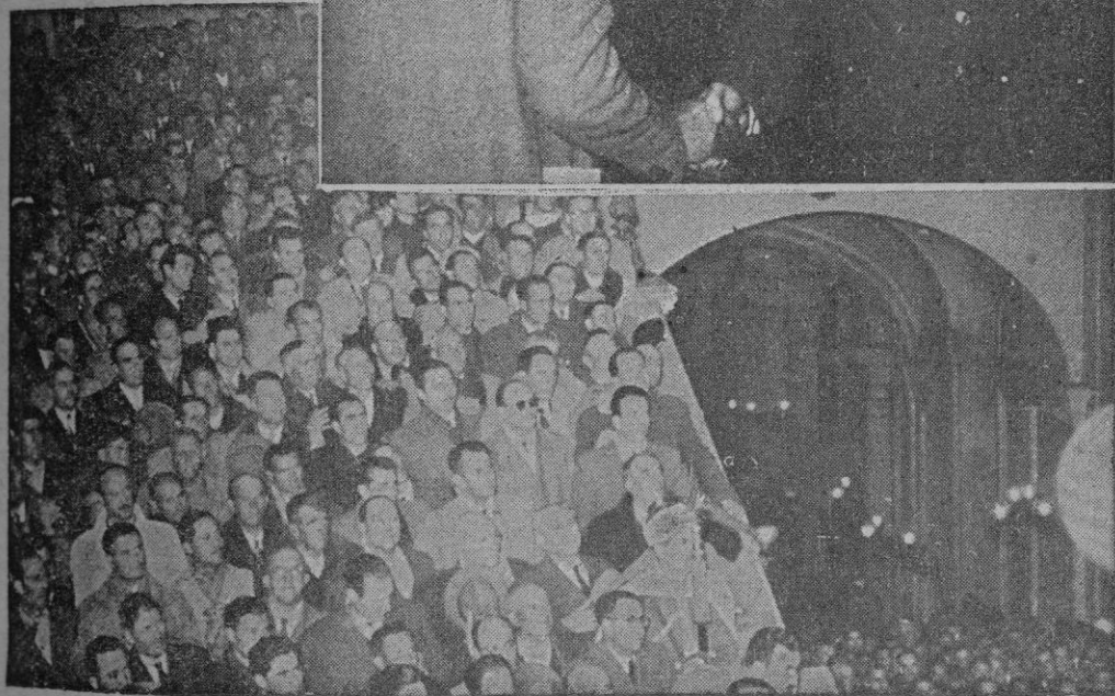
MADRID. — S. E. el Jefe del Estado saluda a una representación de agricultores y ganaderos asistentes a la V Asamblea Nacional del Campo, que acudieron al Palacio de Oriente para entregar al Caudillo las conclusiones de dicha Asamblea. — Los Labradores y Ganaderos de toda España que han participado en la V Asamblea Nacional, escuchan la palabra de S. E. Jefe del Estado en el Palacio de Oriente.—(Fotos "Cifra")