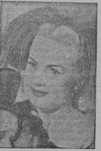
Betty Grable en una escena del film

«Siempre en tus brazos» tiene un punto de gran simpatía gracias al ambiente, principios de siglo, en manos de dos comediantes, de ar-