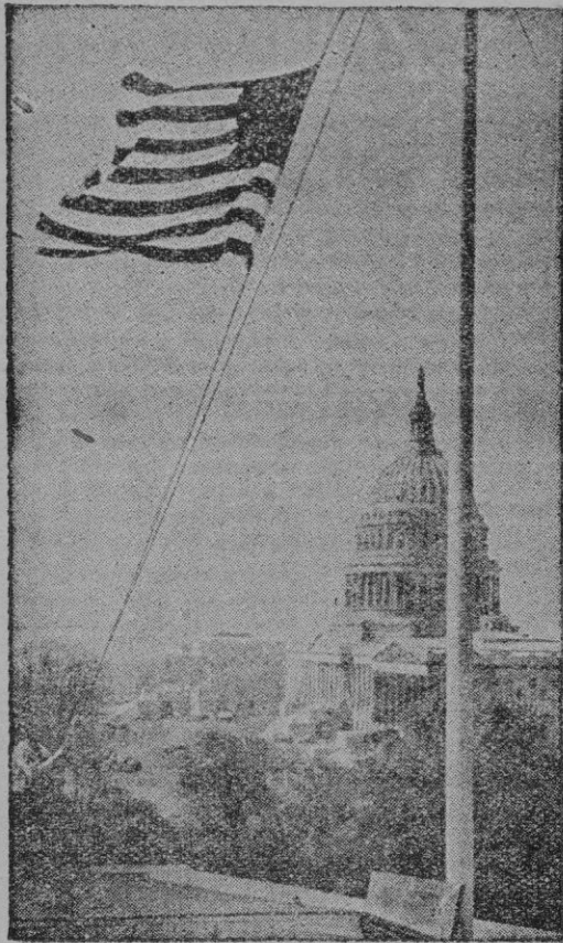
La bandera de las siete barras y las cuarenta y ocho estrellas es izada frente al edificio del Senado norteamericano.