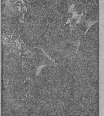
RES prepara una sesión cinematográfica en la Sala Augusta

Para el próximo día 22, por la noche a las 10'30 "BALEARES" prepara una sesión cinematográfica en la Sala Augusta