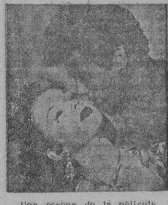
Una escena de la película

La historieta cuenta el caso de un príncipe raptado por un famoso Rey de ladrones que, pagado para matar al Príncipe no se atreve y se lo lleva. Pasan los años y el Príncipe se ha convertido en un galán arrebatador y en un ladrón que arrambla con todo.