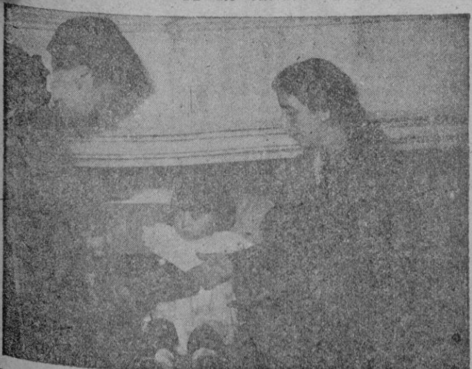
MADRID. — La Tuna de Derecho de la Universidad de Madrid ha hecho entrega del nombramiento de Madrina de dicha Tuna a la niña María del Carmen Martínez Bordiú, hija de los Marqueses de Villaverde y nieta de S. E. el Jefe del Estado. Esta fotografía recoge un momento del acto, celebrado en el Palacio de El Pardo, y en la que aparece, con la pequeña, su abuela, esposa de S. E. el Jefe del Estado, doña Carmen Polo de Franco.

LA NIETA DE S. E. EL JEFE DEL ESTADO, MADRINA DE LA TUNA DE DERECHO DE LA UNIVERSIDAD DE MADRID