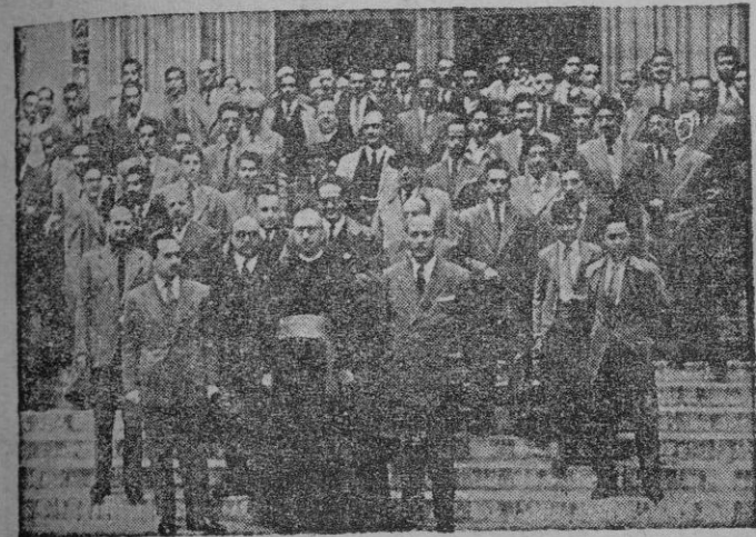
Autoridades y jerarquías provinciales a la salida de los Santos Oficios en la iglesia de Santa Eulalia

El matarratas NOGAT, «polvo grano y pasta fortificada constituye el producto más cómodo rápido y eficaz para matar toda clase de ratas, ratones y topas. Se vende en principales farmacias y droguerías. LABORATORIO S. KATARG, calle del Ter 16. Barcelona. Mandando este recorte recibirá gratuitamente un interesante folleto