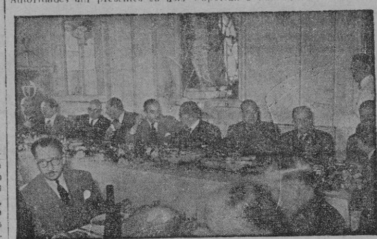
La presidencia de la comida de hermandad de los productores del Sindicato del Metal