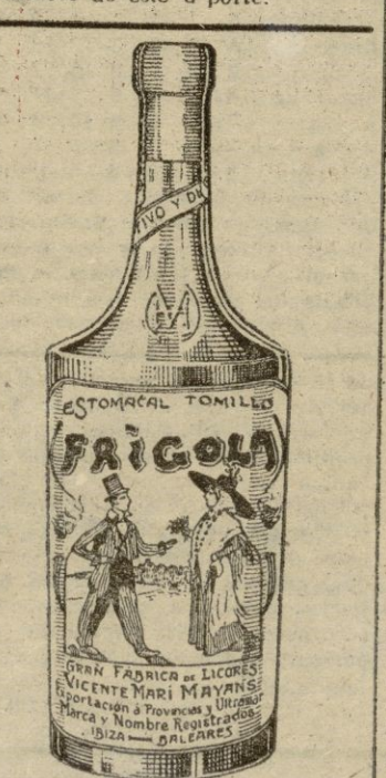
LICOR DE ALTA CALIDAD

En suma, buen aperitivo de principio de temporada, la que ha comenzado bajo los mejores auspicios, y en la que nos será dable presenciar torneos y campeonatos de gran interés, de entre los que destaca por su extraordinaria importancia el campeonato de Baleares de este deporte.