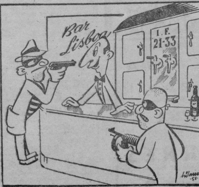
CANDOR ¿Qué van a tomar los señores?