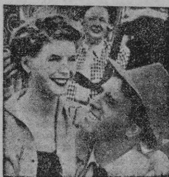
Una escena del film

Otra vez la policía porteamericana en acción. Ahora, en esta ocasión, el Servicio Secreto del Tesoro nos enseña su funcionamiento, sus procedimientos para la captura del criminal, desnudando ante nuestros ojos el tinglado de una perfecta organización en lucha contra la maldad.