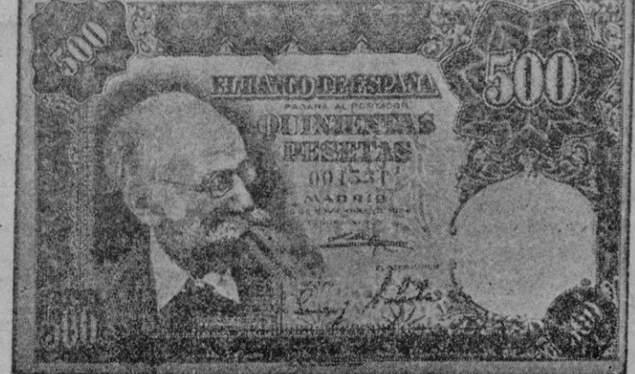
ANVERSO de los nuevos billetes de 500 pesetas que el Banco de España pone en circulación estos días con la efigie del escultor don Mariano Benlliure.

PARA ALIVAR EL FINAL DE MES UN SACO de estos