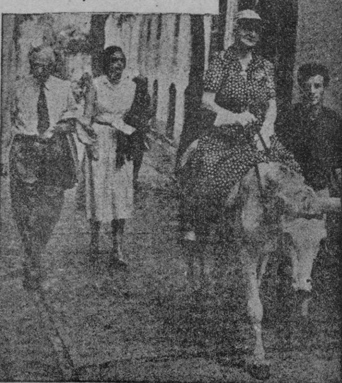
CAPRI. — El general Marshall y su esposa gozan de las pregonadas delicias de Capri. El ex secretario de Estado norteamericano y su esposa han sido sorprendidos por el fotógrafo durante uno de sus frecuentes paseos.