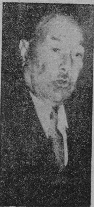
EL CAIRO. — ESTE ES ABDEL SALAAM GOMAA, SUCESOR EN LA JEFATURA DEL PARTIDO WMD DE MUSTAFA EL NAHAS.