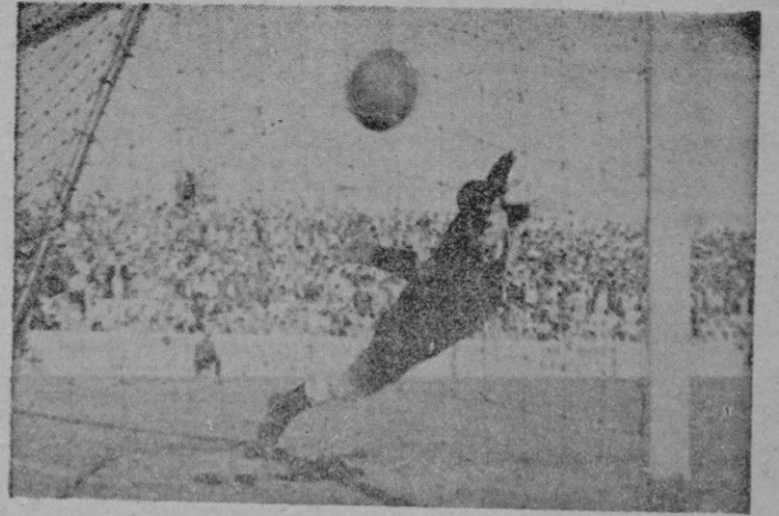
Y aquí otro de sus errores Sr. Lacambra. Este es el gol que marcó de penalty el Atlético Baleares. Un penalty naturalmente, que no era penalty, que todo hay que decirlo