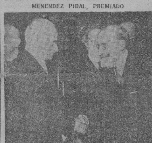
MENENDEZ PIDAL, PREMIADO

A este respecto, otros periódicos se muestran menos cautelosos en sus comentarios. Así, el "Goteborg Aktionposten" indica abiertamente que el aparato fue tirado y derribado y añade que el "Catalina", a su vez, fue atacado en un intento soviético de evitar que los suecos pudiesen descubrir la suerte corrida por el "Dakota". (Continúa en cuarta página)